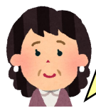
認知症の夫を 介護している方

最近、夫が眠れないのか夜間は1時間おきに起きています。夫は体調はいいと思いますが、私の体調が悪くなりそうです。夫のペースに合わせて生活するのも疲れますが、朝に自分の時間をとるようにしていて、好きな本を読むことが一番のリフレッシュになっています。