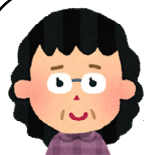
認知症の妹を 介護している方

最近、妹が出来ることが少なくなってきたなと感じます。服を着替える際、ズボンを履いて上着を着るという動作が分からなくなりました。「次はこうだよ。」と声をかけてあげるとその通りに動きますが、自分から考え、行動を起こすことができなくなりました。