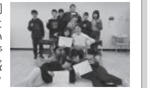
▲長い間ありがとうございました!

3月8日、定例会で6年間ジュニア・リーダーとして活躍してくれた高校3年生4人に感謝状を伝達しました! 卒業生からは「ジュニア・リーダーとして活動するなかで、子供達と関わることの楽しさを知り、将来は小学校の先生になりたいと思う」「学校では体験できないことをたくさん体験することができて楽しかった」「今後も活動を盛り上げてほしい」といった熱いメッセージが後輩達に贈られました。