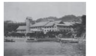
▲ニューパークホテル外観