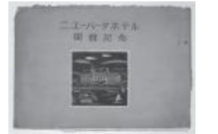
▲パンフレット表紙

ニューパークホテルは残念ながら完成の翌年、昭和15年1月22日に調理場の不始末から出火してほぼ全焼してしまいました(初田・大川1991)。約半年しか営業しなかったこともあり、ニューパークホテルに関連する資料はあまり残されていません。今回発見されたパンフレットには、ホテルの外観写真や内部のイラスト、ホテル図面が掲載されており、我々が見ることの出来ない当時の様子を現代に伝えています。