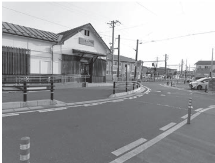
高城町駅前の様子

建設課長 住民からの相談も寄せられているが、駐車禁止区域がないため、利用者のモラルに依る部分が大きいのが現状である。町道については、路上駐車抑制や車両待機場所の利用を促す看板設置を検討し、今後、県や警察と連携して対策を進めていく。