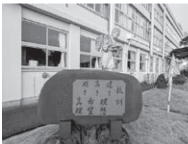
松島小中学校等の生徒児童数が激減

教育長 令和7年5月時点で小学生495人、中学生236人。5年前に比べ小学生34人、中学生35人が減少している。急がねばならないが、もう少し見守ってほしい。