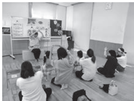
親子参加型事業の様子

問 人口減少・少子化が進む中、松島町が将来にわたり活力を保つためには、子どもを産み育てたいと思える環境づくりが重要だ。これまで実施してきた子育て支援施策について、町としてのどのような成果があったと認識しているか。また、子育て世代の安心感や満足度について町の見解は。