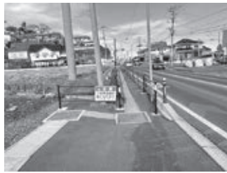
国道45号松島海岸地区

町長 平成5年から交差点改良に向け進めてきたが、用地買収が難航し工事が進んでいない。国も重要区間と認識しており、用地が確保できれば早期着手が可能である。町としても国と協力し地権者との交渉を続ける。