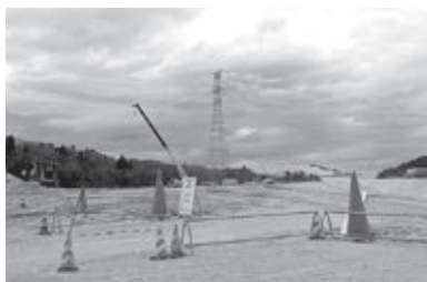
松島イノベーションヒルズの造成工事が進む

問 松島町初原地区で行われている工業団地開発に町の積極的な支援と取り組みが必要である。現在の進捗状況はどうか。課題である道路の取り付けや水の供給などについての取り組みは。