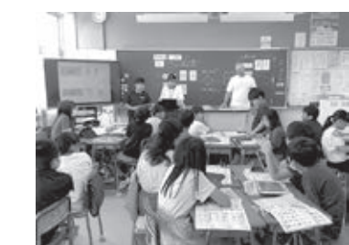
「こども国際観光科」の学習に取り組む子ども達

問 多様な支援が行われている一方で、制度を十分に知らない子育て世代もいる。支援を利用しやすいするため、周知についてどのように工夫していくのか。