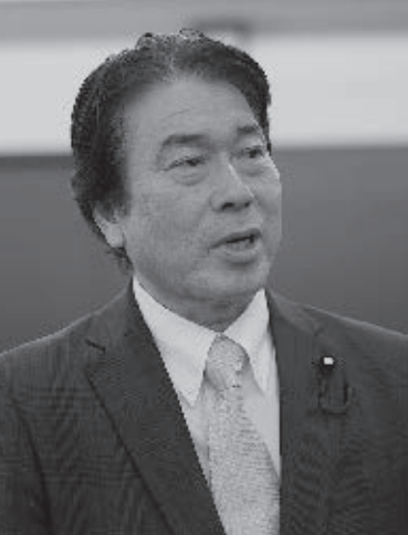
あべ たかし 安部 孝 議員