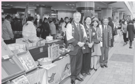
▲左から大橋町長、伊東市長（倉敷市）、倉敷小町、佐藤市長（塩釜市）

15日には、倉敷市の伊東市長、塩釜市の佐藤市長、大橋町長によるトップセールスが行われ、3市町の特産品プレゼントや各首長によるPRに会場は盛り上がりを見せました。