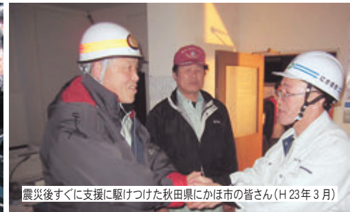
震災後すぐに支援に駆けつけた秋田県にかほ市の皆さん(H23年3月)

平成23年3月11日に発生した東日本大震災は、巨大地震と大津波によって東日本沿岸部へ甚大な被害をもたらしました。