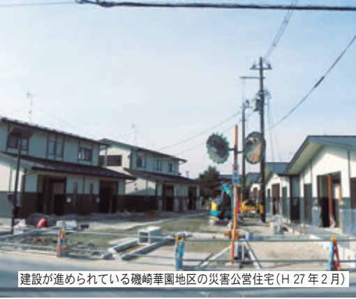
建設が進められている磯崎華園地区の災害公営住宅（H 27年 2月）