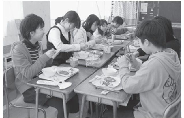
▲地元ホテルの味を学校給食で楽しめるのは松島ならではの取り組みです