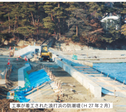
工事が着工された浪打浜の防潮堤（H 27年 2月）