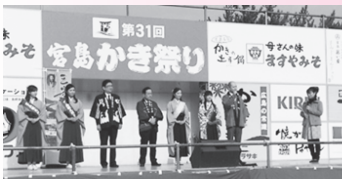
▲日本三景の見どころ紹介