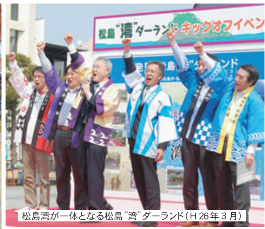
松島湾が一体となる松島「湾」ダーランド（H 26年 3月）

また、震災により大きな被害を受けた手樽フットボールセンターの改修が、国際サッカー連盟と日本サッカー協会の支援により着手され、6月にリニューアルオープンをすることができました。