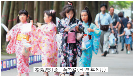
松島流灯会 海の盆(H23年8月)