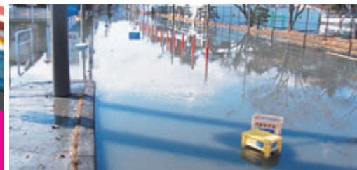
第一小学校前から松島海岸駅まで冠水した国道45号(H23年3月)