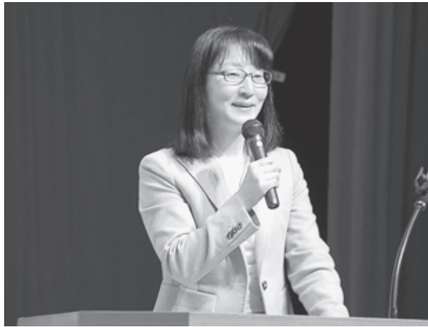
▲旅行先での特別な体験やふれあいが魅力的な観光に繋がるとご講演をいただきました

2月4日、塩竈市民交流センターで、宮城県と松島湾を望む3市3町（塩釜市、多賀城市、東松島市、七ヶ浜町、利府町、松島町）による「第2回松島湾観光フォーラム」が開催されました。