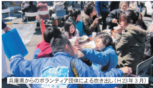
兵庫県からのボランティア団体による炊き出し(H23年3月)