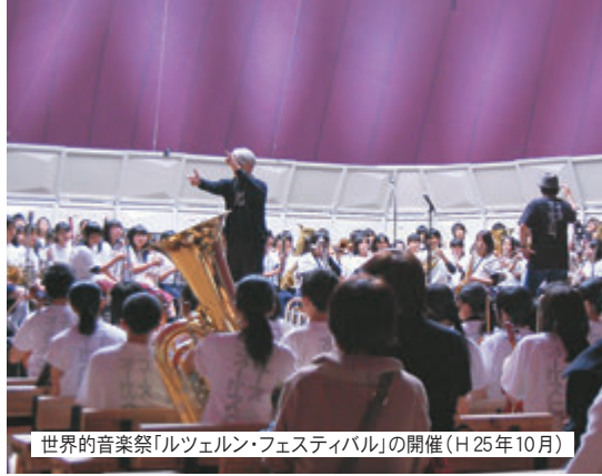
世界的音楽祭「ルツェルン・フェスティバル」の開催（H 25年 10月）