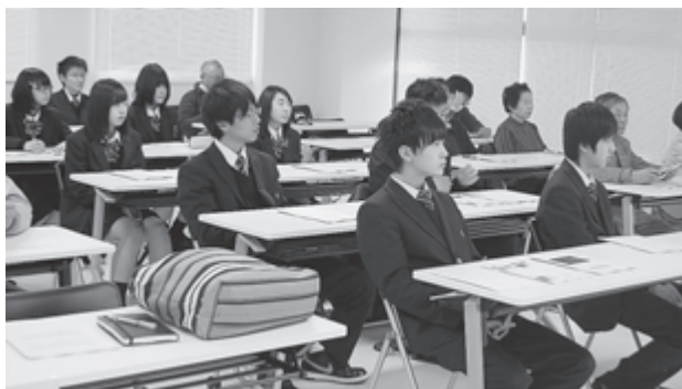
▲松島高等学校観光科の生徒も熱心な眼差しを向けています