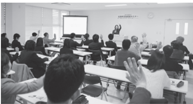
▲「松島が好きですか？」という質問に答える参加者の皆さん