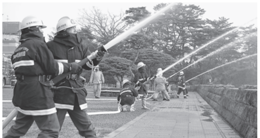
▲放水活動を行う消防団

国の貴重財産である瑞巖寺や五大堂を火災から守ろうと、参加者たちは真剣な表情で訓練に臨んでいました。