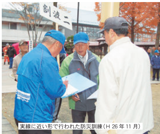
実線に近い形で行われた防災訓練（H 26年 11月）