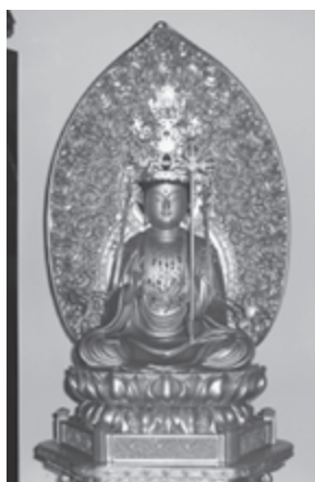
修理後の虚空蔵菩薩坐像

2月に新たに町指定の文化財となったものを紹介したいと思います。富山大仰寺は瑞巖寺百世洞水東初が隠棲した場所として知られ、正保年中（1644～47）に開創されたと考えられます。現本堂は建築技法等から18世紀後半から19世紀初頭の建立と考えられています。明治9年に明治天皇の巡幸があり、現在も行在所跡として顕彰されています。東日本大震災で甚大な被害を受け、平成23年の9月から翌年8月まで解体修理が行われ、併せて屋根葺の全面葺替も実施されました。