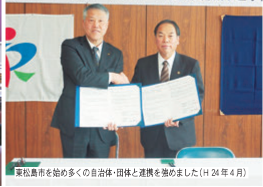
東松島市を始め多くの自治体・団体と連携を強めました（H 24年 4月）