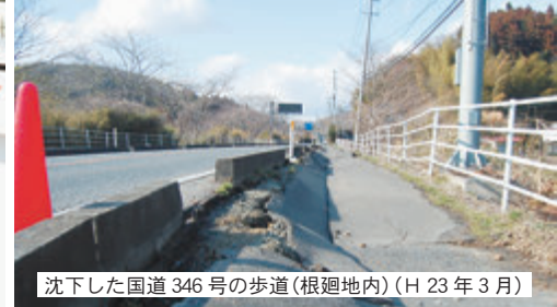
沈下した国道346号の歩道(根廻地内)(H23年3月)