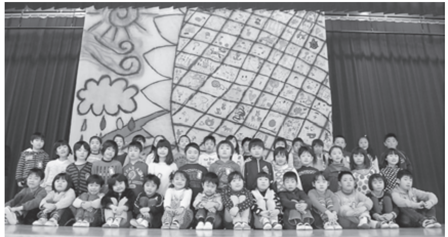
▲第一小学校1年生と完成した「大きな絵」

プロジェクトに参加した第一小学校の児童たちは、大きなひまわりの絵を描きました。この絵には子どもたちがひまわりのようにすくすく育ってほしいという願いが込められています。1年生と2年生、3年生が協力して完成させました。