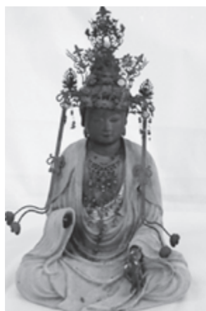
修理前の虚空蔵菩薩坐像