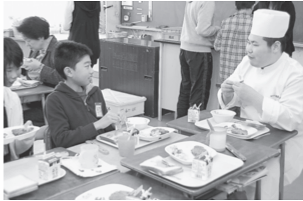
▲メニューを考案したのは松島三ツ星冬ランチでグランプリを獲得した一流の料理人

児童たちは特別な給食メニューで大満足の様子で、地元のホテルに親しみを持つきっかけにもなったようです。