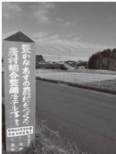
平成元年時事業標柱（幡谷地区）

副町長 北部の圃場整備エリアと、特定都市河川による流域治水対策のポンプ場改修整備を一体的に捉えることが大事であり、財政面を含め様々な面を検討していきたい。