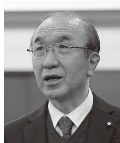
ごとう よし ろう 議員 後藤 良郎