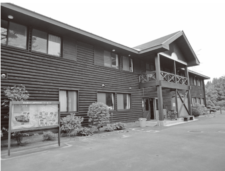
松島町野外活動センター

副町長 指定管理者が管理していく上で、古い建物は、当然、維持管理費もかかる。物価高騰、光熱費も加味して各施設を考えている。指定管理の条件の中で、目安とした額であれば指定管理者でお願いするが、それ以上超えれば行政が修繕するなど協議して対応していく。