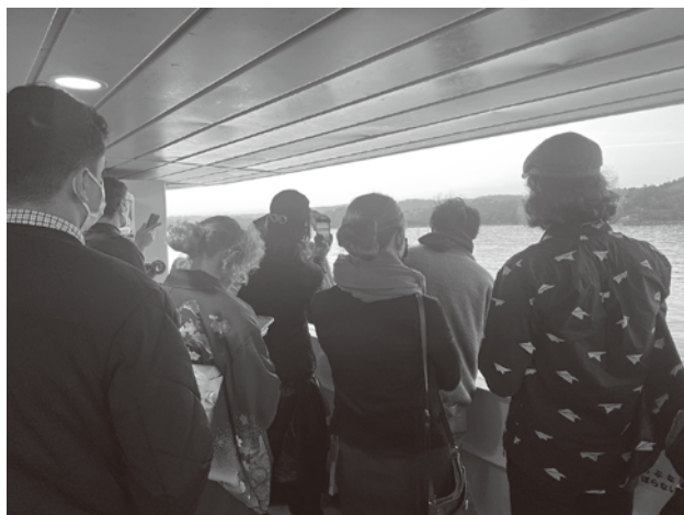
着物を着て遊覧船を楽しむ外国人観光客

町長 国や県の海外プロモーションやPR活動など、近隣市町村や観光事業者と連携をしながら情報発信を行っている。また、外国人観光客には特別感のある高付加価値の体験型コンテンツ等を提供できるよう取り組む。