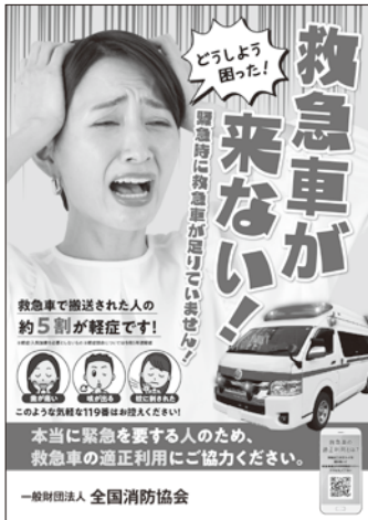
全国消防協会ポスター

危機管理監 救急車の適正利用については、広報まつしまに年2回掲載するのに加えて、今年度より再開した応急救命講習