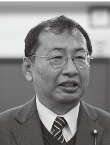
さくら い やすし 櫻 井 靖 議員