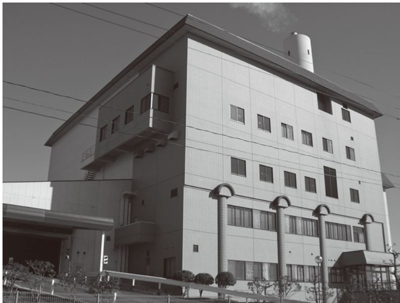
宮城東部衛生処理センターごみ焼却施設

町長 現在の焼却施設は、建設より29年が経過しており、今後の対応が必要であると認識している。人口減少や生活意識、産業活動の変化など社会情勢を的確に捉え、環境に配慮した施設となるよう議論していく。