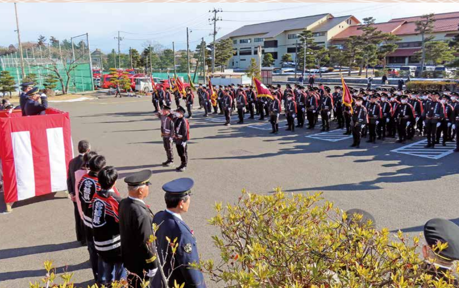
消防団総勢 150人による出初式