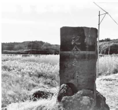
事業記念之碑（幡谷地区）

副町長 行政施策は住民の理解と協力が欠かせない。住民の視点に立ち、必要とされる防災対策を講じることが重要である。道路幅員4m未満の狭い道路は、全町にわたって存在しており、道路拡幅や隅切りの整備は、住民からの協力が不可欠である。住宅の建て替え時などに協力をもらい検討、整備をしているのが現状である。