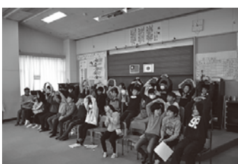
五小の児童がオンラインで台湾の児童と交流する様子

教育長 姉妹校協定については課題が多いため今のところ予定していない。松五小以外においても宮城県国際政策課等と協力して、他国を含めた国際交流の機会を今後も大切にして取り組む。