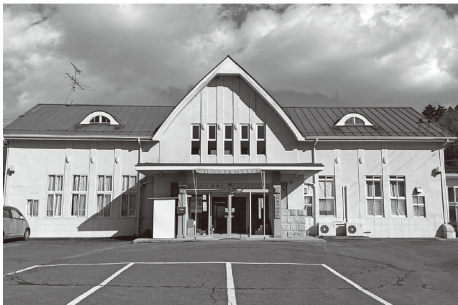
松島町健康館の全景