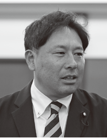
なか じま かず と 中 島 一 都 議員