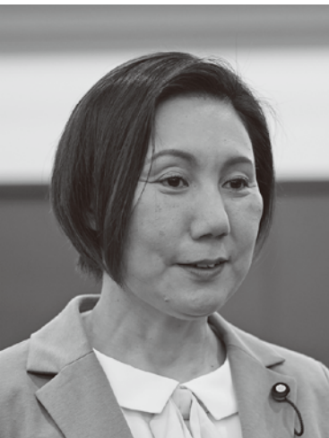
おざわ ようこ 小澤陽子 議員