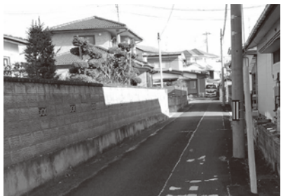
狭い公道の一例（高城地区）

町長 コロナ禍で延びたりはしたが、定期的にやる。例えば来年の3月に各地区から新たな行政区役員が上がった段階で、研修会を行い今後のまちづくりについて意見交換をし、どのような行政懇談会を行ったらいいかも意見を受けて、検討し進めていきたい。