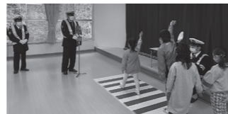
▲松島第一幼稚園交通安全教室の様子