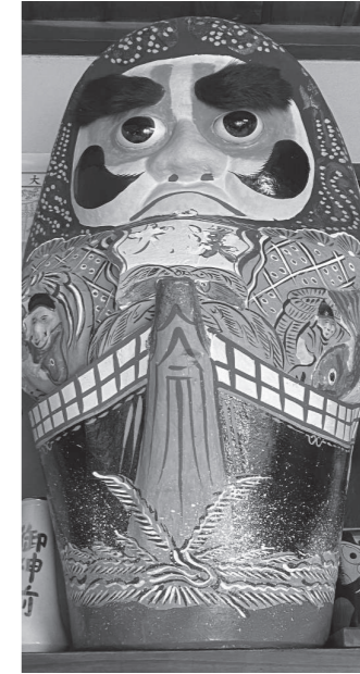
▲高城O家所蔵資料(下半分は宮城県沖地震で破損し修復)