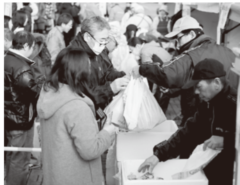
▲写真はイメージです