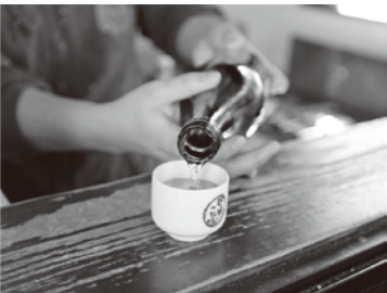
▲写真はイメージです。感染症対策のため、プラカップでの提供となります。