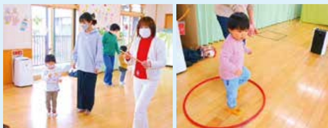
1月11日㊦リズムあそびの会

日曜・祝日・年末年始 新型コロナウイルス感染予防の為、開館時間を短縮 しています。詳しくは児童館までお問い合わせください。