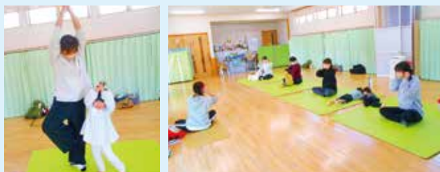
2月9日㊦親子ヨガ教室