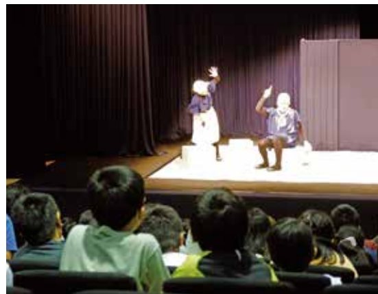
▲おもしろい場面の数々に身を乗り出して鑑賞していました