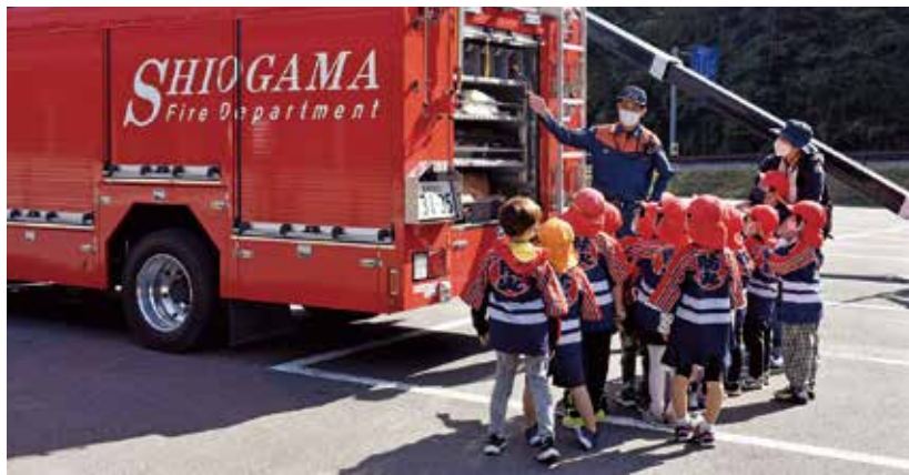
▲車両の装備や仕組みの説明を受ける園児たち