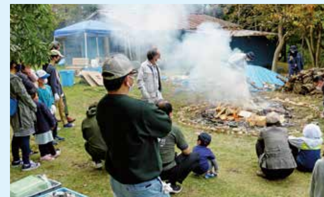
大きなたき火で土器を焼く様子をみんなで見守ります

松島町手樽地域交流センターと塩竈市公民館に分かれて粘土から土器の形を作り、約2ヶ月乾燥させた後、七ヶ浜町の大木田貝塚公園で野焼きをしました。