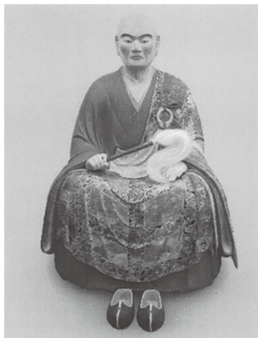
修復を終えた現在の洞水禅師倚像