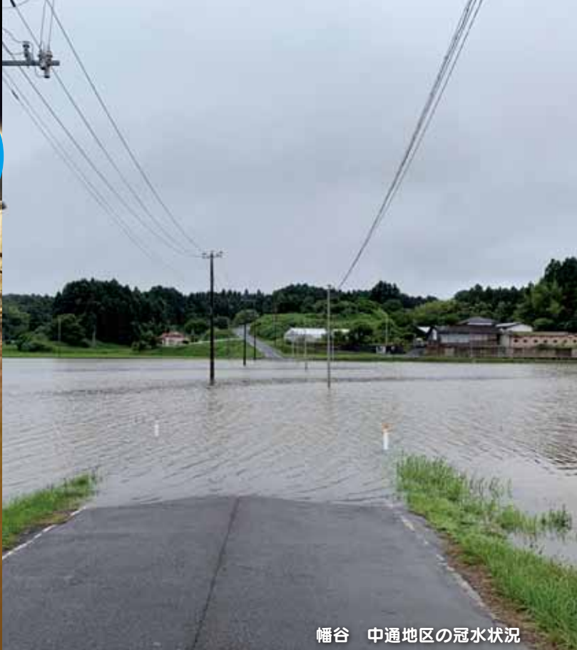
幡谷 中通地区の冠水状況