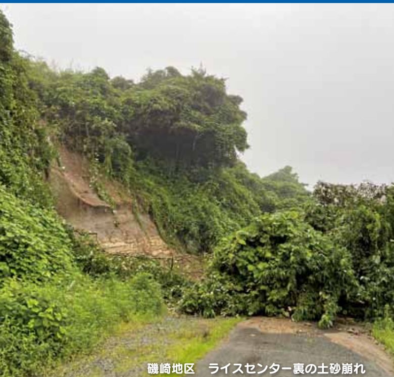
磯崎地区 ライスセンター裏の土砂崩れ