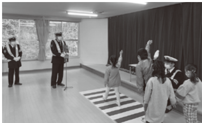
▲松島第一幼稚園交通安全教室のようす