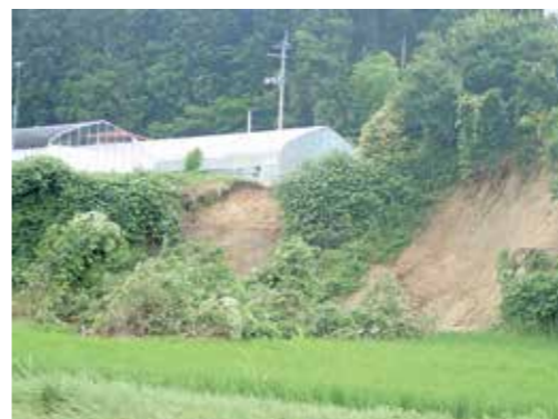
▲崖崩れ(桜渡戸地区)