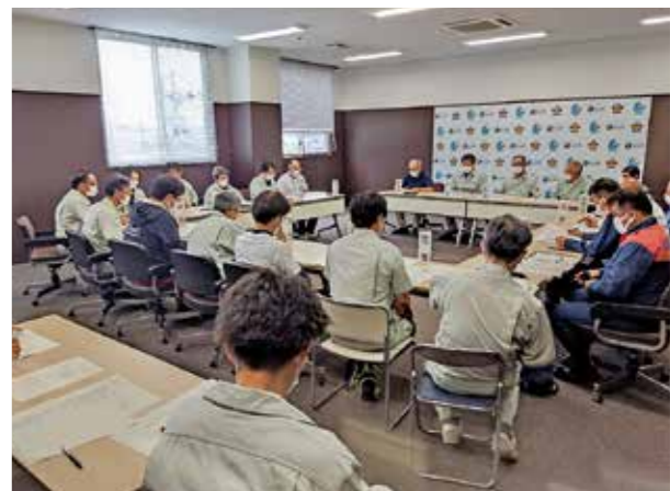
▲災害対策本部の様子

7月15日から16日にかけての大雨により被害を受けられた皆様に心よりお見舞い申し上げます。 この大雨により、町内では多くの浸水被害や土砂崩れなどの被害が発生しました。午後10時30分には、本町では初めてとなる「記録的短時間大雨情報」が発表されました。 記録的な雨量を観測 松島浄化センターに設置している雨量計では、7月15日と16日の48時間で314mmの雨量を記録し、7月15日の午後10時から16日午後3時までの短時間で228mmと記録的な雨量となりました。 1時間に約100mmとなる短時間の大雨により、降り始めからすぐに道路の至る所が冠水し、住宅への浸水被害や農地の冠水、土砂崩れ、道路の陥没など、町内では大きな発生しました。 崖崩れや道路の陥没などにより、町内では通行止めや東北本線、仙石線、仙石東北ラインが7月19日まで運転を見合わせ、また、町営バスは7月21日まで運休となるなど、住民生活にも大きな支障をもたらしました。