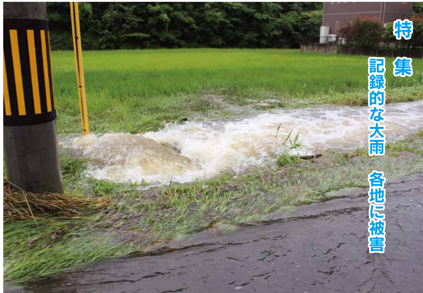
▲水路から道路に水が溢れる(根廻地区)