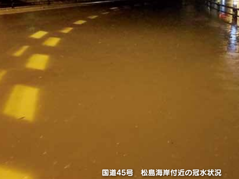
国道45号 松島海岸付近の冠水状況