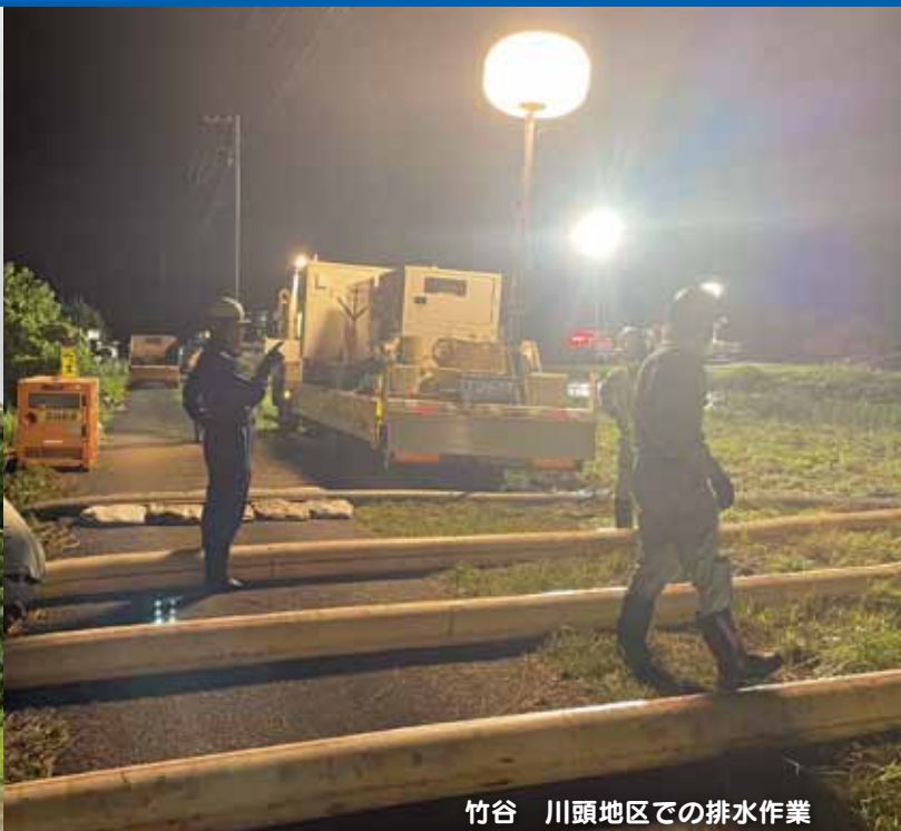
竹谷 川頭地区での排水作業

町の 公式 LINE に登録してみませんか？ 防災情報など様々な時事情報を配信していきます！