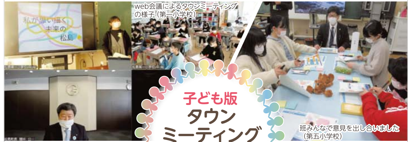
web会議によるタウンミーティングの様子 (第一小学校)