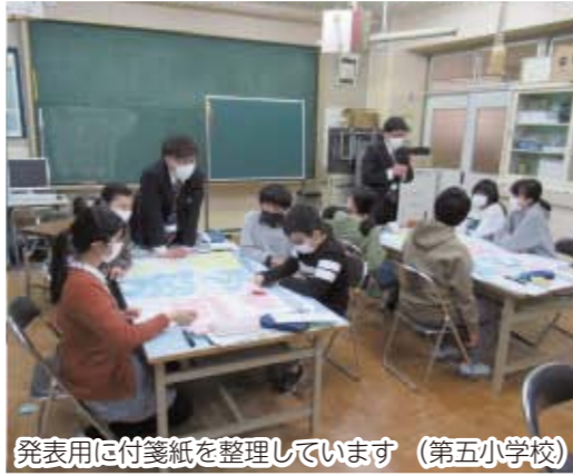
発表用に付箋紙を整理しています (第五小学校)