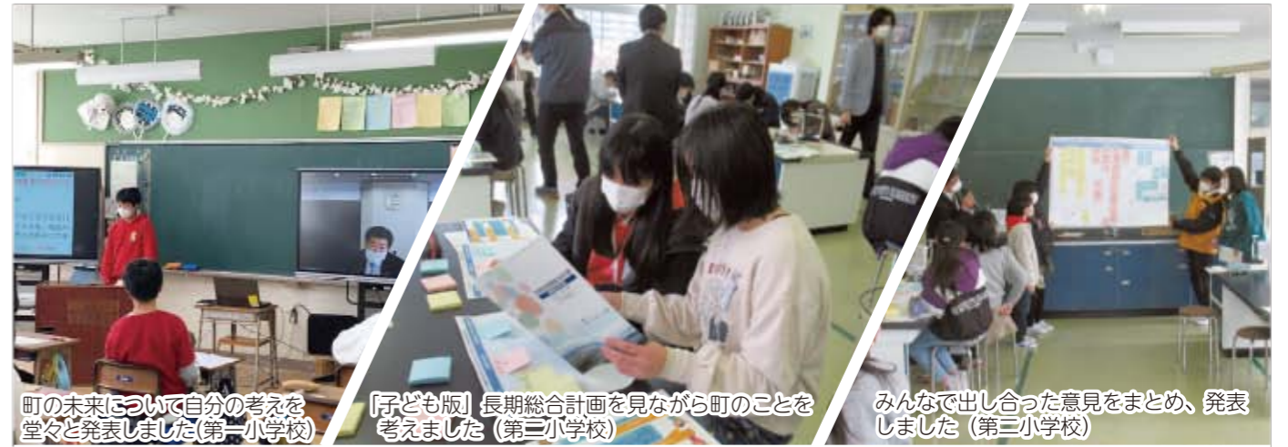
町の未来について自分の考えを堂々と発表しました (第一小学校)