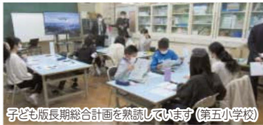
子ども版長期総合計画を熟読しています (第五小学校)