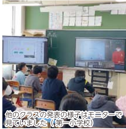
他のクラスの発表の様子はモニターで見っていました (第一小学校)