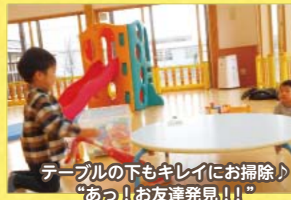
テーブルの下もキレイにお掃除♪ “あっ!お友達発見!!”