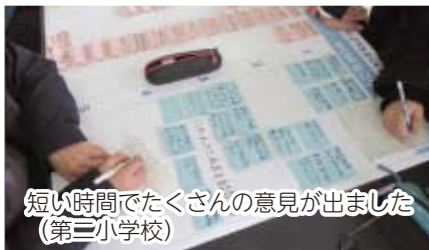
短い時間でたくさんの意見が出ました (第三小学校)