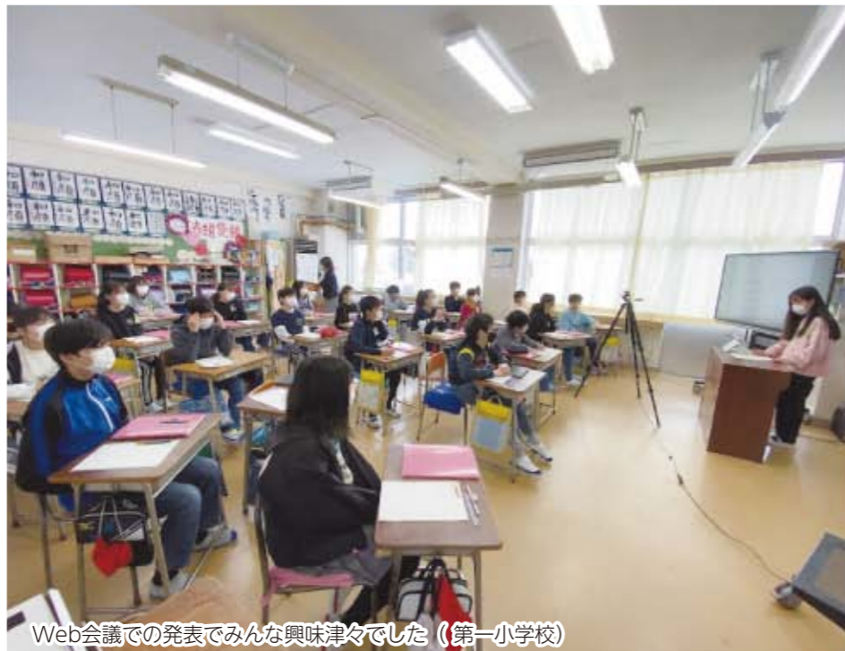
Web会議での発表でみんな興味津々でした (第一小学校)