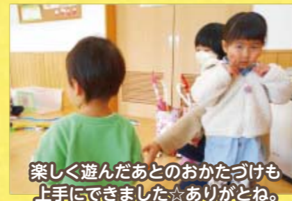
楽しく遊んだあとのおかたづけも上手にできました☆ありがとね。