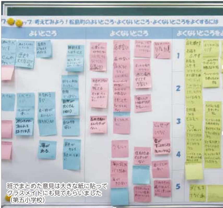
班でまとめた意見は大きな紙に貼ってクラスメイトにも見てもらいました (第五小学校)