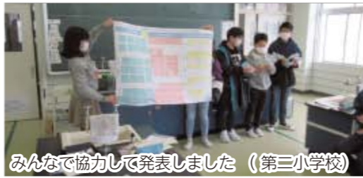
みんなで協力して発表しました (第三小学校)