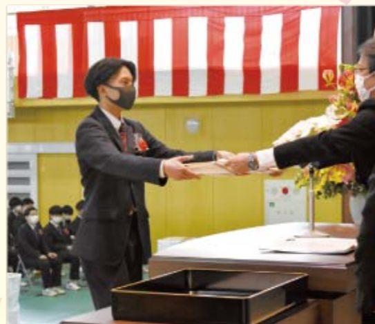
宮城県松島高等学校

令和3年度 卒園式・修了式 卒業証書授与式 新型コロナウイルス感染症拡大防止のため、規模を縮小して挙行された「卒園式・修了式・卒業式」。 例年の賑やかな雰囲気とは異なり、落ち着いた雰囲気での式となりました。別々の道へ進む友との別れを惜しむ生徒もおり、かぎられた時間の中でたくさん思い出を残していました。 卒園、修了、卒業された皆さん、そして保護者の皆さん、あらためておめでとうございます。皆さんの新たな旅立ちを、松島町は心から応援しています。