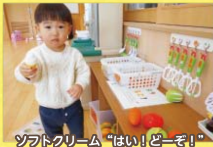
ソフトクリーム“はい!どーぞ!”

児童館は、児童福祉法第40条による児童福祉施設です。赤ちゃんから18歳未満の年齢の子供達は、誰でも遊びに来ることができる場所です。子ども達は、「遊び」を通じて、考え、決断し、行動し、責任を持つという「自主性」「社会性」「創造性」を身につけ成長していきます。そのため、児童館では幅広い年齢の子供たちが楽しくふれあひながら過ごせる場所を提供しています。小中学生向けのイベントや、親子を対象とした教室やイベント、育児の相談等の支援も行っています。