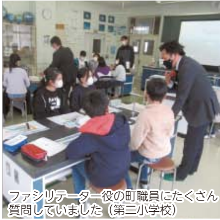
ファシリテーター役の町職員にたくさん質問していました (第三小学校)