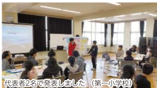
代表者2名で発表しました (第一小学校)