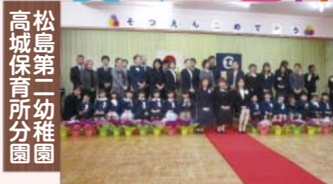
松島第二幼稚園 高城保育所分園