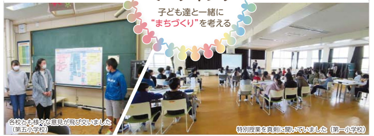
各校とも様々な意見が飛び交いました (第五小学校)