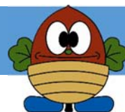
松島町マスコットキャラクター 「どんぐりまっちゃん」

(専用サイト : http://www.town.miyagi-matsushima.lg.jp/index.cfm/7,33298,21,512.html )