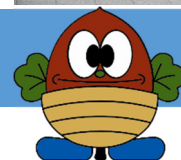
松島町マスコットキャラクター 「どんぐりまっちゃん」

(専用サイト : http://www.town.miyagi-matsushima.lg.jp/index.cfm/7,33298,21,512.html )