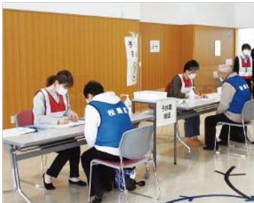
▲受付後に体温測定と予診票を確認します