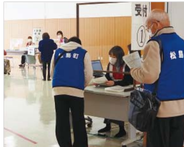
▲受付で身分証や接種券などを確認します