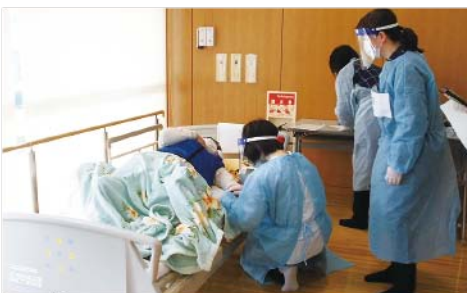
▲体調不良を想定した救急要請訓練もしました