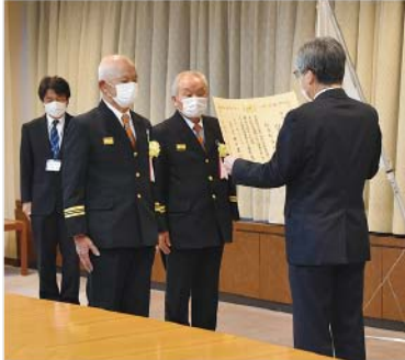
▲宮城県庁で行われた伝達式の様子