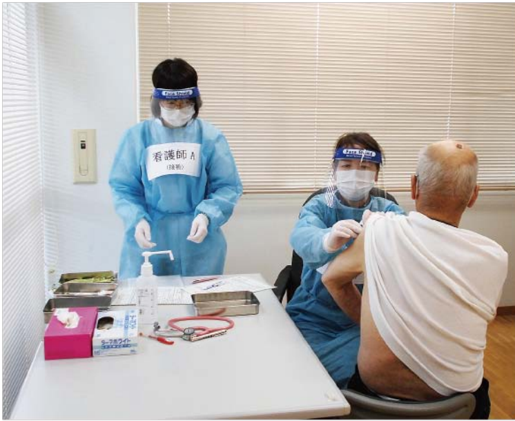
▲ワクチン接種訓練のようす

高齢者の町民の接種を想定し、接種会場に予定している保健福祉センター「どんぐり」の施設を使いそれぞれが役割を分担し、受付から接種までの一連の流れに沿った実践的な訓練のようすをお伝えします。