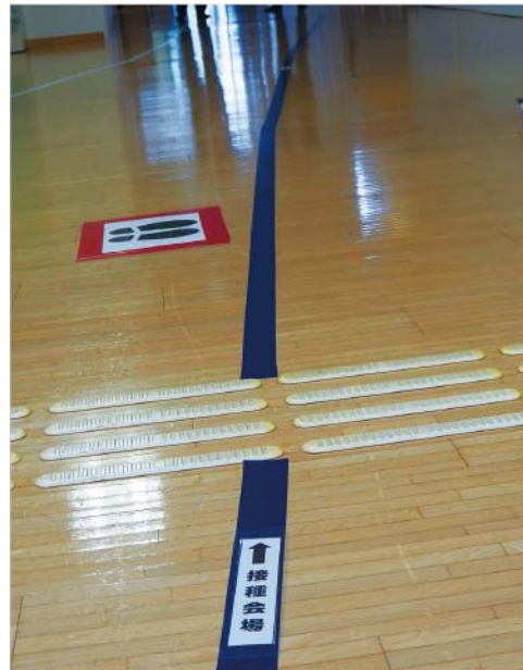
▲床の矢印にしたがって接種会場へ進みます