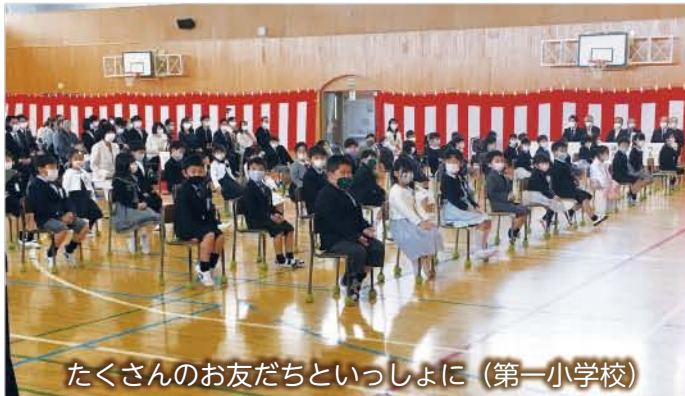
たくさんのお友だちと一緒に (第一小学校)