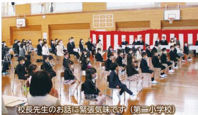
校長先生のお話緊張気味です (第二小学校)