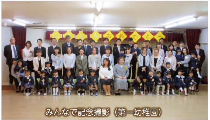
みんなで記念撮影 (第一幼稚園)