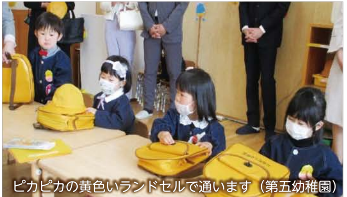
ピカピカの黄色いランドセルで通います (第五幼稚園)