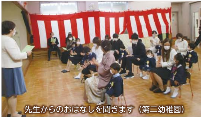
先生からのお話を聞きます (第二幼稚園)