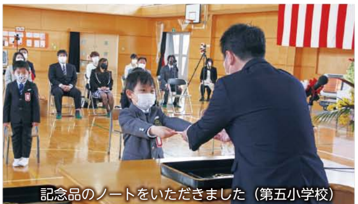
記念品のノートをいただきました (第五小学校)