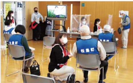
▲接種済証交付・次回の予約後は体調を観察します