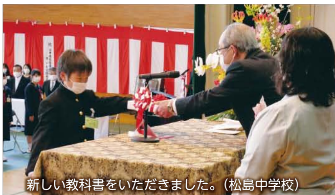
新しい教科書をいただきました。(松島中学校)

4月9日、町内の幼稚園、小学校と中学校で入学式が行われました。 保護者の方々が見守る中、真新しいランドセルや制服姿の新入生たちは、緊張しながらも希望と期待を胸に、笑顔で入学式に臨んでいました。 今年度、本町3つの幼稚園で25人、3つの小学校で87人、中学校で99人が入園・入学し、幼稚園や学校での生活をスタートさせました。