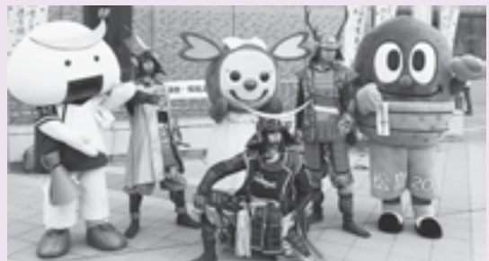
▲松島町のマスコットキャラクターどんぐり松ちゃんと東松島市の観光PRキャラクターイーナちゃんも登場

きめ細やかな情報発信で、松島湾岸一帯を多くの観光客に周遊していただくことを目的に、様々な場所で観光PRを実施しています。