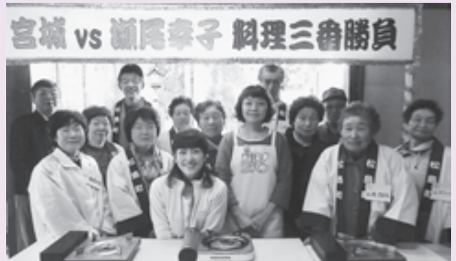
▲生放送で出演した手樽古浦漁業組合の皆さん

本町では、町花で幻の花「セッコク」の栽培に奮闘する人々の姿や、童謡どんぐりころころの誕生秘話などが紹介されました。また、手樽古浦漁業組合の皆さんが生放送で出演し、古浦地区で採れる大きなアサリを使った料理を披露しました。