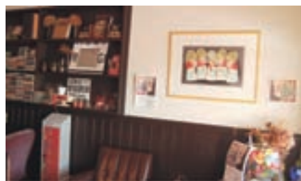
▲Cafe & Bar LYNCHのオーナーは秋田県にかほ市出身