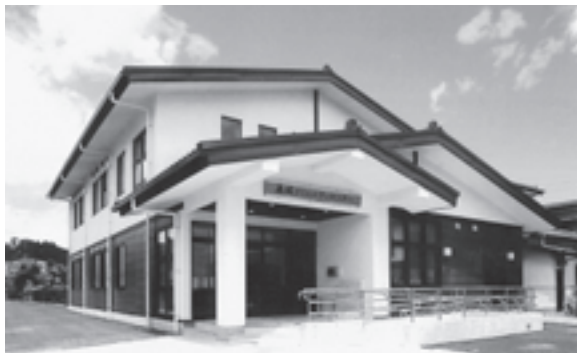
▲2階建ての高城コミュニティセンター

なお、この施設は集会施設として、高城区が指定管理者となり管理運営にあたります。今後は、地域住民の文化、交流活動の場などとして大いに活用されます。