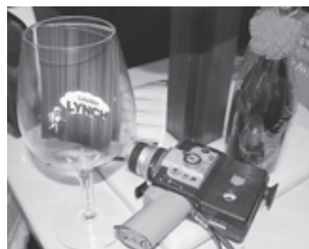
▲ちょっとした置き物にもこだわった店内

昨年9月、磯崎の海岸沿いに真っ赤な店がオープンしました。Cafe & Bar LYNCHはオーナーの「好きな物」が沢山詰まったシネマ・カフェ。日中はオムライスなどのランチも食べられ、そして夜はお酒を提供するバーになります。映画のパンフレットやポスター、重厚な家具が並べられ、ライトに照らされた店内は松島にいることを忘れさせるような空間です。