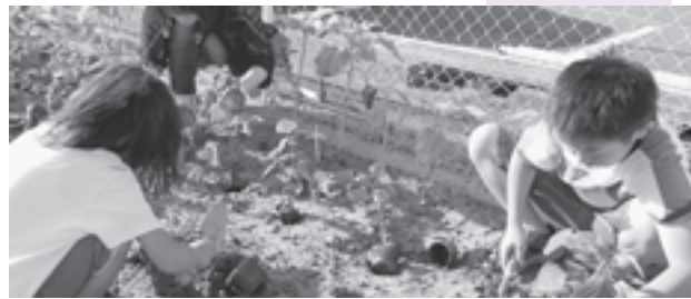
▲丁寧に花を植える子どもたち

6月14日(土)の早朝、親子での花植作業が実施されました。今回はコメリ緑資金助成事業の一環で実施されました。