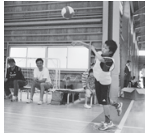
▲輪の中から出ないようにボールを投げます