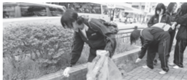
▲毎年の恒例行事です

毎年恒例の松島高校歩け歩け大会が、5月23日町内で開催されました。各学年がそれぞれコースに分かれ、町内を歩きながらゴミ拾いをしました。この歩け歩け大会は、奉仕活動を通してボランティア精神の育成と松島の環境美化に努めることを目的に毎年開催されています。