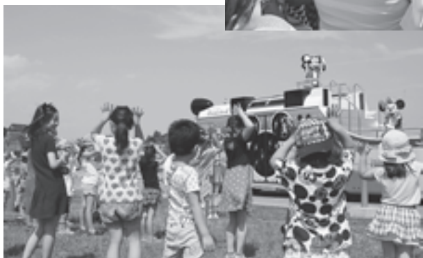
▲ミッキーたちと一緒に「ミッキー音頭」をおどりました