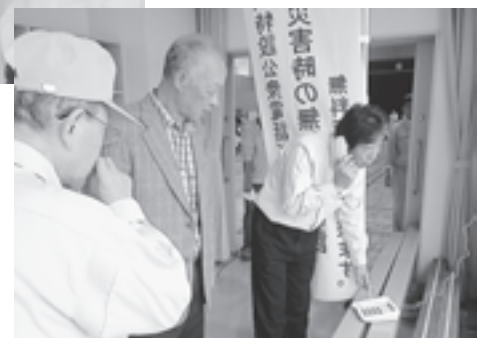
▲公衆電話の訓練も行われました