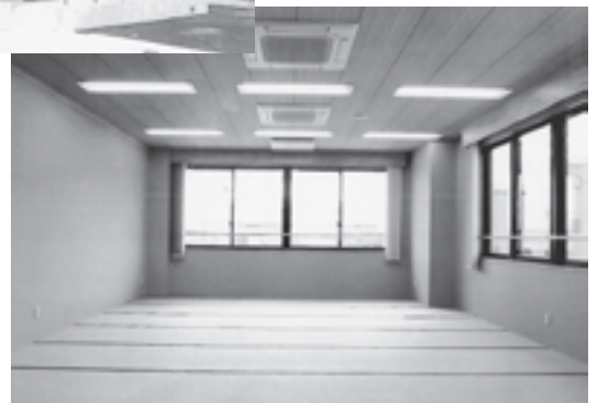
▲広々とした2階の和室