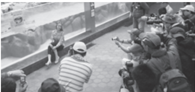
▲水族館のペンギンを背景に