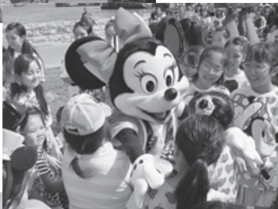
▲子どもたちが「ミニーマウス」とハグ！