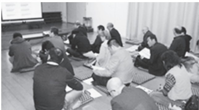
▲景観重点地区を対象に行われた説明会

平成26年6月1日から松島町景観条例および景観法に基づく、事前協議および届出制度がスタートしました。事前協議などの対象となる区域は町全域になります。協議が必要な規模には基準がありますので事前にご相談ください。