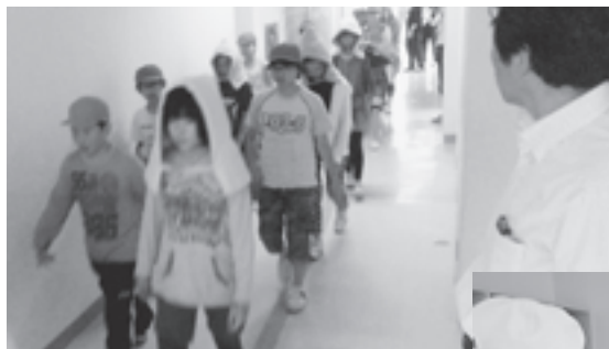
▲真剣な表情で訓練にあたる児童たち

また、当日体育館では地区代表者らも参加し避難所開設訓練にあたり、備蓄物資の保管状況や災害時避難所用公衆電話の設置訓練等を実施しました。