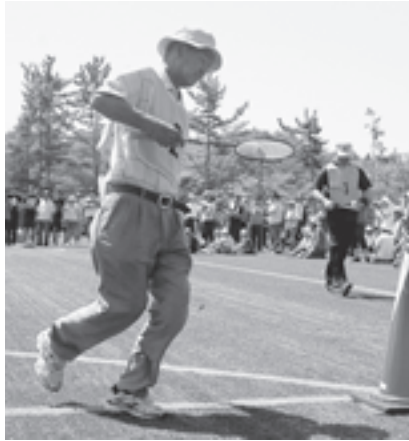
▲大人も子どももたのしいふれあいいりレー

参加した方は「毎年、孫とのスポーツを楽しみにしている」と汗をかきながら、元気に青空の下で競技を楽しんでいました。