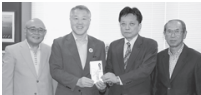
▲後日寄付金を頂きました

今年で30回目となる全日本写真連盟と朝日新聞が主催する、復興チャリティー2014松島モデル大撮影会が松島公園周辺で開催され、当日は雨天にもかかわらず、県内外から131人の写真愛好家の方が参加しました。参加者は、マリニピア松島水族館の生き物や雨の松島を背景に、4人のモデルを被写体としてシャッターを切っていました。