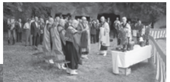
▲安全祈願をする瑞巖寺の僧侶のみなさん