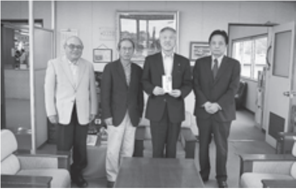
▲寄付に訪れた全日本写真連盟の皆さん

同連盟は、6月2日に町内で開催された「復興チャリティー松島モデル大撮影会」を主催し、参加者約200名から寄せられたお金を寄付していただきました。