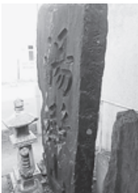
▲造立年代が刻まれた石碑の側面