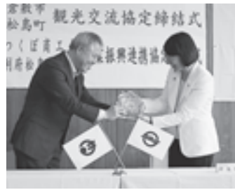
▲倉敷市との絆が深まりました