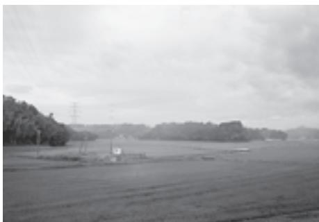
▲下竹谷の田園風景

ここ下竹谷は近くに吉田川が流れていることなどから、稲作が大変盛んな地域で、明治と平成に、ほ場整備が進み、面積の広い水田が多い地域になりました。