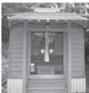
▲震災の被害から住民の手によって修繕された熊野神社

先の震災では土台などが破損してしまいましたが、修繕するための材料は住民からの寄付金で購入し、修繕作業は自分たちの手で行いました。地区の守り神を自分たちの手で再建できたことには感激しました。