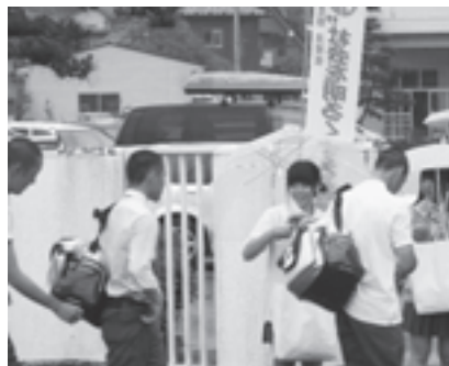
▲声かけ運動を展開しました

第 63 回社会を明るくする運動の一環として、7 月 11 日に松島中学校と松島高校で、生徒の皆さんが保護司や更生保護女性会、民生委員児童員など関係者とともに、朝の声かけ運動を行いました。7 月 9 日には、同運動実施委員会がパレス松洲で開催されました。