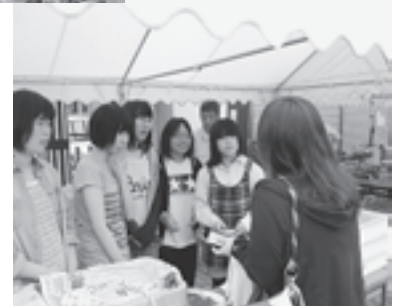
▲松島高校の生徒も参加しました