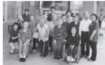
▲楽しいひと時を共に過ごしました