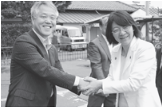
▲来庁した伊東市長（右）と歓迎する大橋町長

児童たちは、関係者から説明を受け、積極的に質問する姿が見られました。見学会を通して地元の貴重な文化財を身近に感じるよい機会となりました。