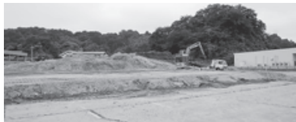
▲ JR 松島駅に隣接する仮庁舎建設現場 (7 月 16 日撮影)

仮庁舎は、延べ面積約 3,000 m 2 の鉄骨造 3 階建てで、7 月に建設が始まり、外溝工事を含めた完成は平成 26 年 3 月の予定です。