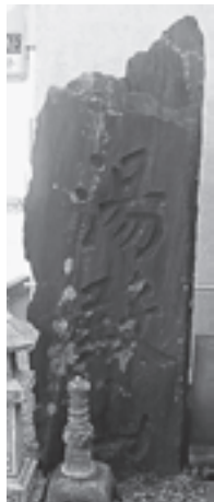
▲湯殿山と記された石碑