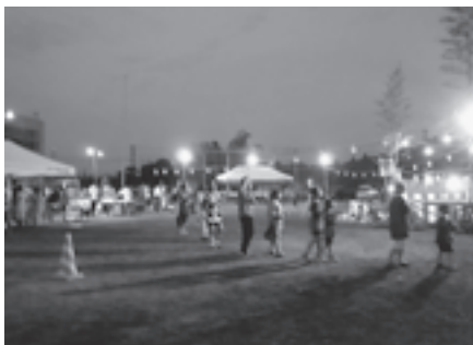
▲親子三代で楽しむ盆踊り大会

ますが、昔は地域で協力して行っていたので、その名残がまだ残っています。今も草刈りや地域清掃を行う際には住民が総出で参加しています。また、東部交流センターに、パークゴルフの練習場があり、老若男女問わず練習に参加し、年2回行われる大会は大変な盛り上がりを見せます。