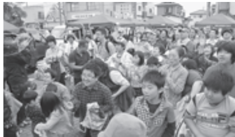
▲多くの人で賑わいました