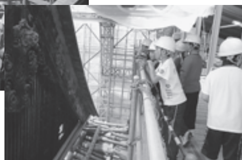
▲こうして間近で屋根を見れるのは、あと何年後でしょうか？