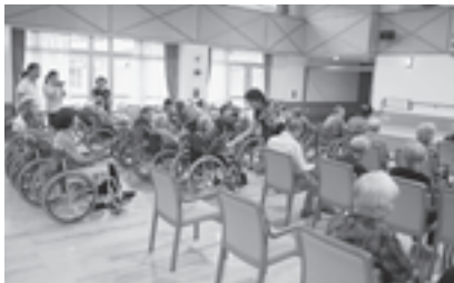
▲入居者の方とのふれあい