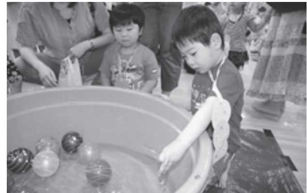
▲うまく取れたかな？

毎年恒例の「ながよしまつり」が子育て支援センターで開催されました。水ヨーヨーすくいやくじ引きなど、いろいろなゲームコーナーが用意され、会場となった保健福祉センターどんぐりでは、参加した子どもたちの笑顔であふれていました。