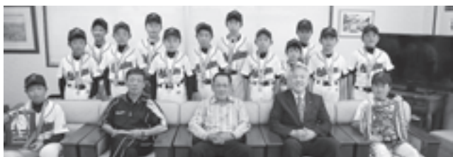
▲準優勝を報告した松島ジュニアクラブの皆さん

松島ジュニアクラブが、宮城県スポーツ少年団軟式野球交流大会で準優勝を果たし、町長に報告しました。同大会に出場したのは総勢 264 チーム。惜しくも優勝は逃しましたが、8 月 9 日から埼玉県所沢市で行われる「くりくり少年野球選手権」への出場権を獲得しました。