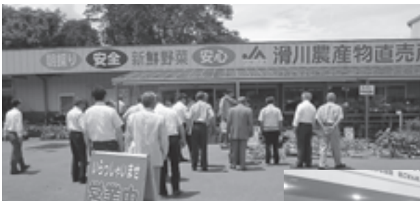
▲滑川町の農産物直売所を見学