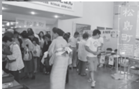
▲松島物産展を開催