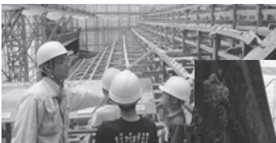
▲説明を聞く顔は真剣そのもの