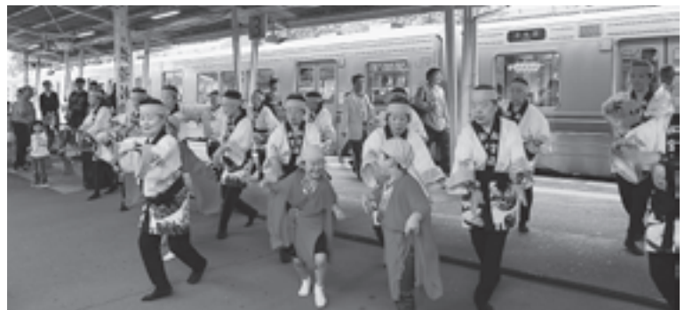
▲DC期間中多くの町民の方におもてなしをしていただきました