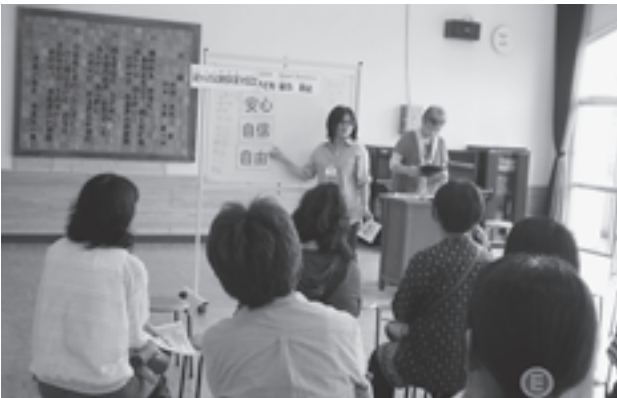
▲熱心に説明を聞く保護者の方々