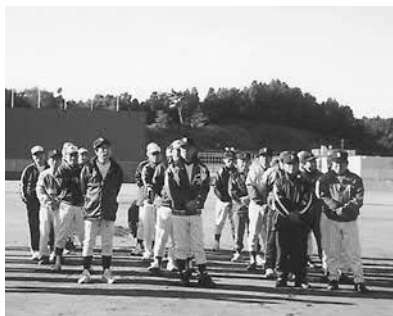
▲開会式での選手たち