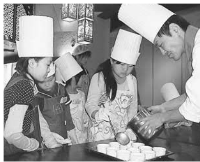
▲シェフからプロの味を教わりました