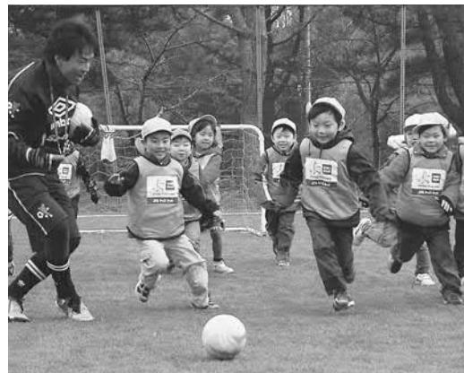
▲元気いっぱいボールを追いかけてました