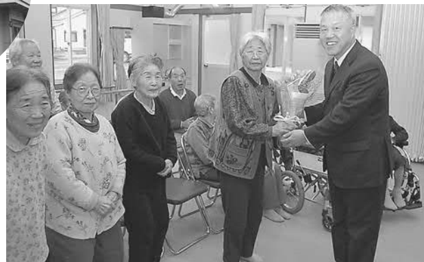
▲施設の利用者の方から花束を受けとる大橋町長