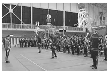
▲昨年(2019年)の出初式の様子

今年1年の無火災を祈念して、松島町消防団出初式を挙 行します。纏を先頭に消防団員による力強い行進や纏振 りが披露されます。