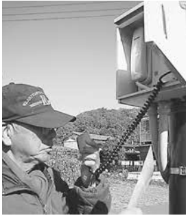
▲防災行政無線を使った訓練

午前十時に地震が発生したことを想定し、避難訓練や救命訓練、安否確認訓練等を実施。今回から地区民の避難場所が従来の旧手樽生活センターから手樽地域交流センターへ変更されたため、地区民が避難に要する時間を検証・確認した結果、安全確認に