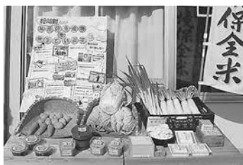
▲昇降口に並んだ地場産品