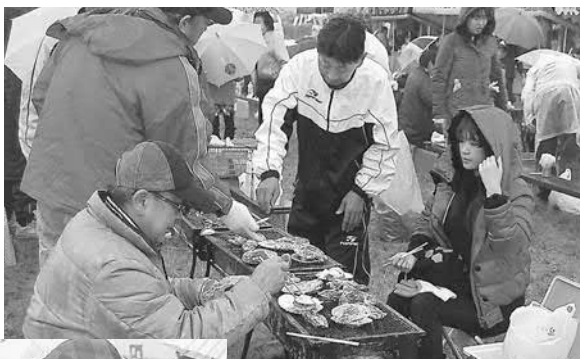
▲焼きあがるのが待ち遠しい