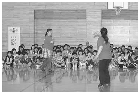
▲不審者対応の防犯教室の様子

各種啓発活動や、研修会の実施、防犯灯の設置など、町や警察、関係機関が中心となって行う取り組みと、『子ども一〇番の家』、『地域あいさつ運動』など、地域での防犯活動を合わせて、町全体の安全対策を進めます。