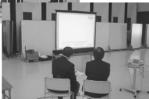
▲スクリーンを使っでのPRコーナーを設けました