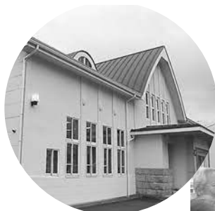
▲綺麗に整備された健康館デイサービスセンター

また、児童福祉に取り組んでいる希望園や保育所の床やトイレなども改修しました。町では、今後も福祉行政の充実を目ざし福祉施設の改修を進めます。