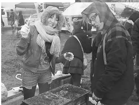
▲おいしさに笑顔が自然にこぼれます