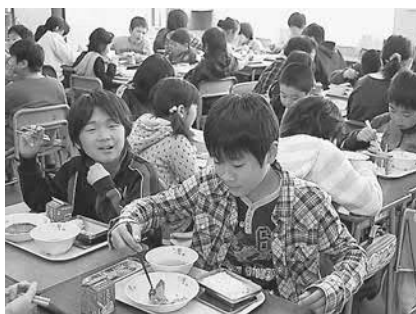
▲松島産はおいしい

子どもたちは、「どれも全部おいしいけど、特にご飯が甘くて美味しい」と味わいながら残さず食べていました。