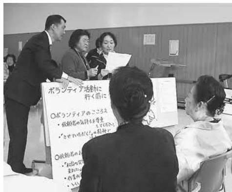
▲スタッフ役とボランティア役に分かれて臨場感あふれる訓練になりました

設置訓練は、震度六の大地震で家屋の倒壊やライフラインの寸断などの被害を受けたという想定で行われました。参加者はグループに分かれてスタッフ役とボランティア役を交互に行い、災害ボランティアとしての役割を体験していました。