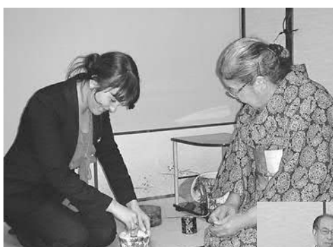
▲茶道体験など日本の伝統文化を学びました