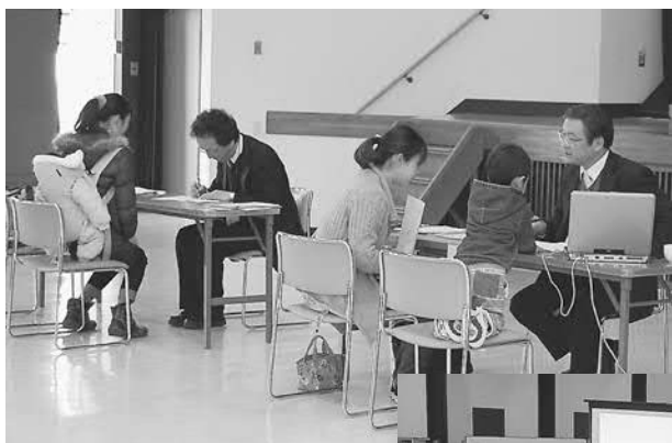
▲町内での開催なので気軽に参加できました