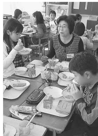
▲第一小学校の5年生は食材の生産者と一緒に給食を食べながら楽しく交流しました