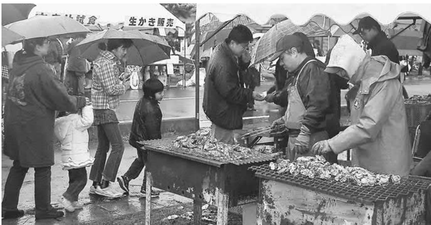
▲無料試食コーナーは、長蛇の列ができるほど大盛況でした