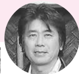
松島町観光親善大使 速水けんたろうさんも 新成人のお祝いに駆け つけます！