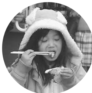
▲あつあつのかきをほおばりました