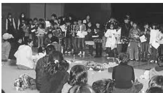
▲一足早いクリスマス音楽祭の様子

私達長生会の人たちがこのような会に参加させていただき、子どもたち、PTAの人たちと触れ合うことは心に感謝、感謝の二文字です。本当に楽しい一日を親子三代で楽しませていただきました。ありがとうございました。