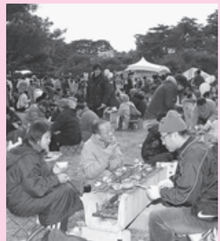
▲新鮮な魚貝類をたっぷり食べられるかきまつり