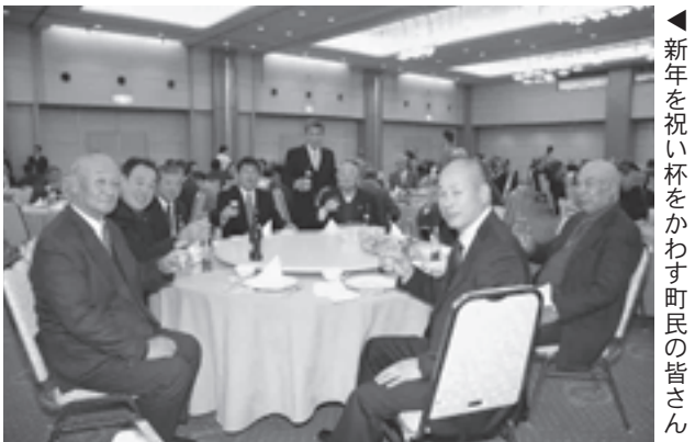
◀新年を祝い杯をかわす町民の皆さん