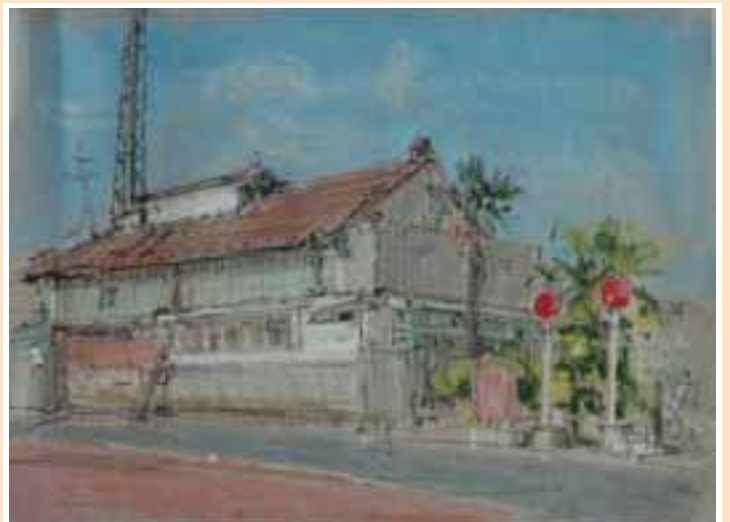
▲煙突が銭湯であったことを物語っています

料金を支払って入浴する公衆浴場の「銭湯」。今では少なくなり、入ったことがない人が多くなりました。高城町の角にあった「角の湯」は、町内唯一の銭湯で、明治時代の初期に創業し昭和五十年代まで営業していたそうです。今も建物があり、煙突も残されています。多くのお客さんでにぎわった昭和初期の「角の湯」は、地域の住民や親子のコミュニケーションの場所ともなっていたようです。