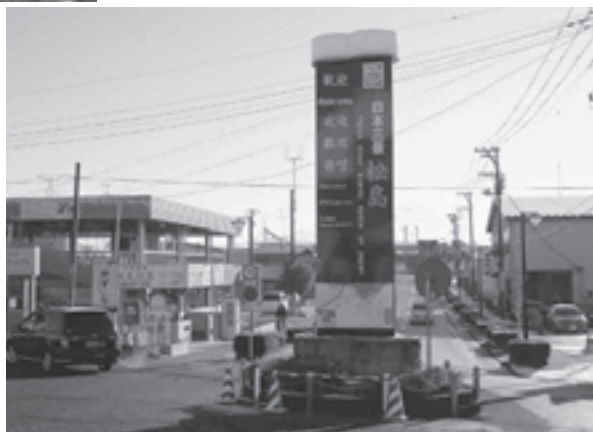
▶松島駅前にある歓迎塔