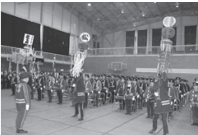
◀威勢のよい纏振り