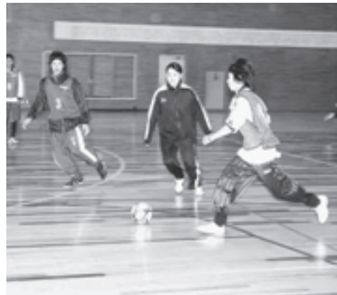
▲ 女性も大活躍しています