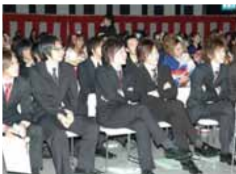
▲ 思い出のスライドショーでは、なつかしい写真に歓声があがりました