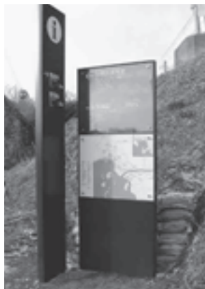
◀統一したデザインで整備された観光案内板

また、松島駅前には日本語をはじめ英語、中国語二種、ハンガール語、ロシア語、フランス語、ドイツ語の八カ国語で、訪れた観光客への歓迎の気持ちを表す歓迎塔が設置されました。