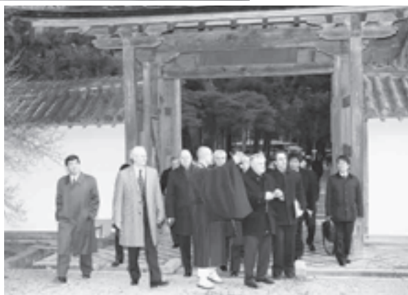
▶瑞巖寺を見学する一行