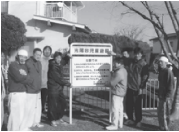
▲ 看板の塗り替えを行った青年部の皆さん

職工組合青年部の皆さんは、毎年、ボランティアで保育所や公共施設の修繕をしています。今回は、子どもたちが安全で快適に遊べるようにと、さびていた看板の塗り替えを行いました。看板は職人さんの腕により見違えるくらいにきれいに塗り替えられました。