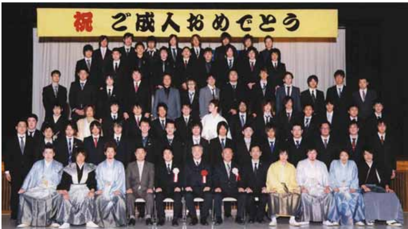
▲ 凛々しい袴姿とスーツ姿の男性陣