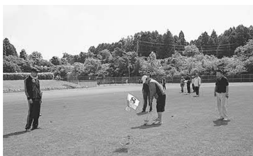
▲町民ふれあいスポーツ大会でのグラウンドゴルフ