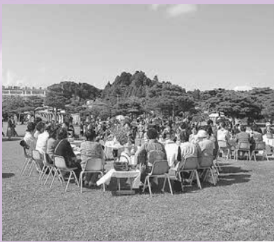
▲各流派毎に縁席を設け来場者を迎えます

日本三景・松島の景観の中で、日本の伝統文化の一つである「茶道」の各流派が一堂に会し、お点前を披露する松島園遊茶会は二十二回目を迎えます。 初秋のさわやかな青空の下、松島のもつ「和」の雰囲気の中で野点のお茶会が気軽に楽しめます。ご家族連れでどうぞお越しください。 ●日時 十月三日(日) 午前10時～午後三時三十分 (受付三時まで) ●場所 松島海岸グリーン広場 ※小雨決行 ●内容 各流派が野点縁席を設けます。また、一般のお客様を対象として茶道教室を開催します。(無料)