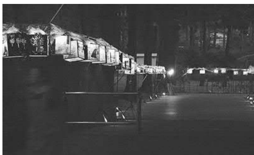
▲ほのかな光の吊り灯籠

また、今年は「幸福のロウソク」として青・赤・緑色のロウソクが一本ずつ毎日違った場所に設置されました。三色探せると幸せになれるとあって、子どもたちなどは必死に探し回っていました。