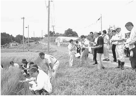
▲白い花を咲かせる環境保全米を視察する町内の宿泊施設等の関係者

ツアーに参加した町内の宿泊施設や飲食店の関係者は、化学農薬などを減らすことで、田んぼの生き物たちの種類や数がどのように変わるのかなどを、実際の生物を見ながら説明を受けました。その後、春に田植え体験をした幡谷地区の水田で順調に生育しているササニシキとその花を見学。生産農家との意見交換会では米粉を使ったパンなどが振る舞われました。参加した宿泊施設の関係者は「環境保全米にかける生産者の熱意を感じた。ぜひ、環境保全米を利用したい」と話していました。