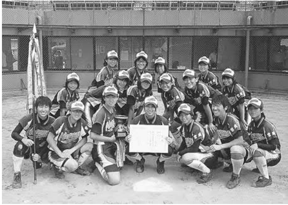
▲県中総体優勝を決め、笑顔の部員たち