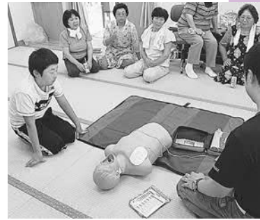
▲小学生もりっぱな地域の一員です

明神崎地区自主防災会は、平成十八年六月に結成されました。組織は一班と二班があり、二十一世帯で活動しています。自主防災組織の活動を通し、地域のコミュニケーション作りも積極的に行っています。七月二十四日には、品井沼干拓歴史資料館で水消火器を使用した初期消火訓練や毛布を使用した簡易担架の作成、AEDの使用方法を