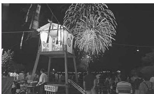
▲供養花火が打ち上げられた大施餓鬼