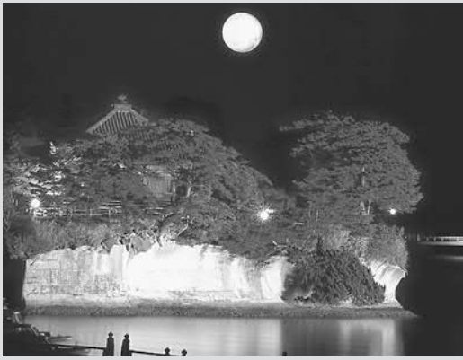
▲芭蕉を魅了した松島の月