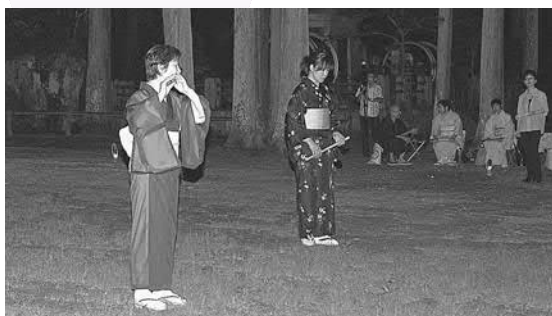
▲篠笛の音が癒しの世界を演出