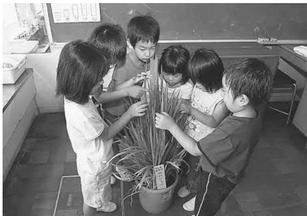
▲身長と同じ高さに育った稲を見てびっくりする子どもたち

園児たちは九月にもバケツ稲の生育状況を観察して、根もとから刈り取って脱くし、もみすりする予定です。