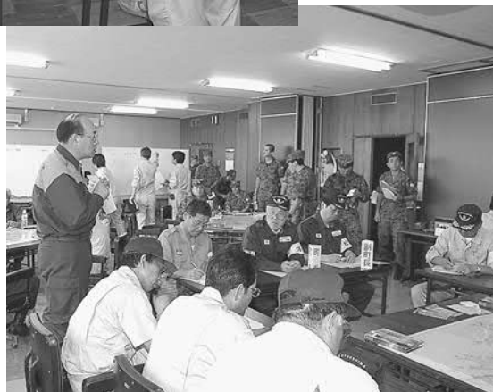
▲自衛隊や消防署との連携が不可欠です