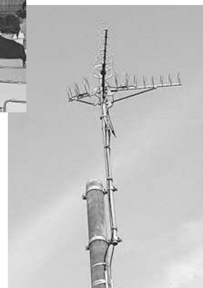
▲新設されるギャップファイラー