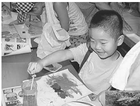
▲吊り灯籠上手に描けるかな