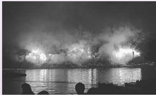
▲次々と打ち上げられる花火が松島湾を彩りました