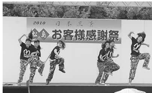
▲躍動感あふれるダンスを披露した松島高校の皆さん