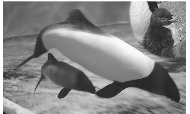
▲かわいい姿で人気を集めているイロワケイルカとイワトビペンギンの赤ちゃん