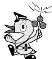
宮城県警シンボルマスコット 「みやぎくん」