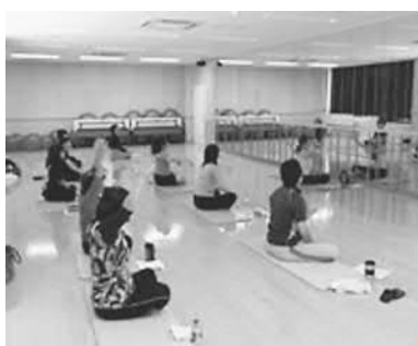
▲美遊でのヨガ教室

※体育指導委員…松島町内では十人の体育指導委員が委嘱され、町のスポーツ振興、発展、及び各種スポーツ教室の指導のために活動しています。