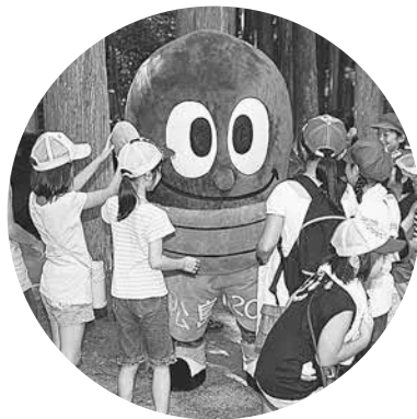
▲どんぐり松っちゃんも大人気でした