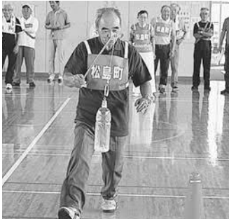
▲奮闘する松島町のチーム

第十七回宮城県身体障害者 仙台地方連絡協議会体育大会 が八月三日に佐藤記念体育館 (亘理町)で開催されました。 宮城県、黒川郡、亘理郡の 各身体障害者福祉協会のうち 八町村の代表が輪投げ競走や フライングディスクなど七つ の種目で競技しました。