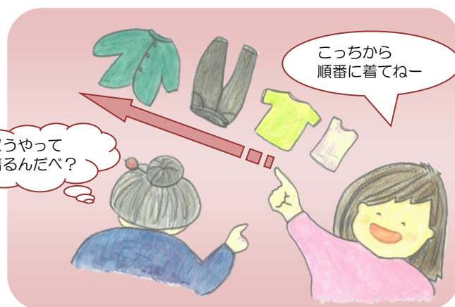
着る順番がわからない