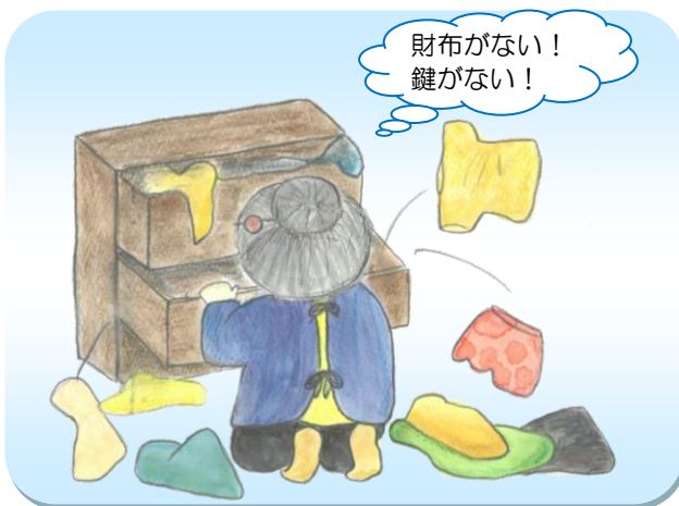
いつも探し物をしている