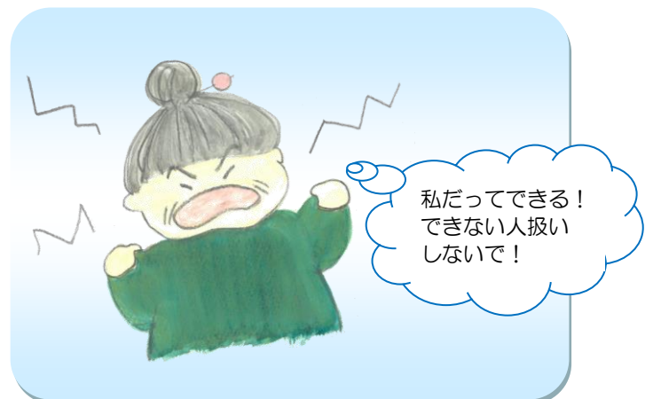
怒りっぽくなった