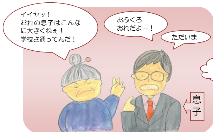
家族のことがわからない