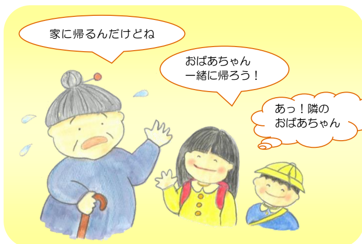
慣れた道でも迷ってしまう