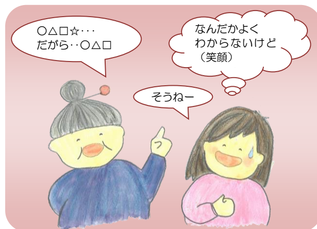
何を言いたいかわからない

● わからないが増えてきますが、全てがわからないわけではありません。温かい気持ちは伝わります。落ち着かない様子の時は、手を握ったり大きく背中をさすったりすると安心できます。