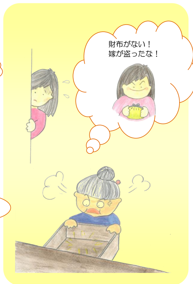
財布の置き場がわからなくなり、 家族に盗られたと言う