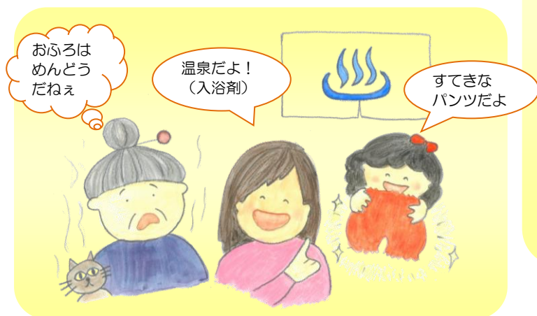
お風呂に入りたがらない