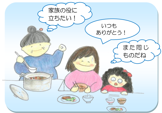
昨日作ったことを忘れ、同じ料理ばかり作る