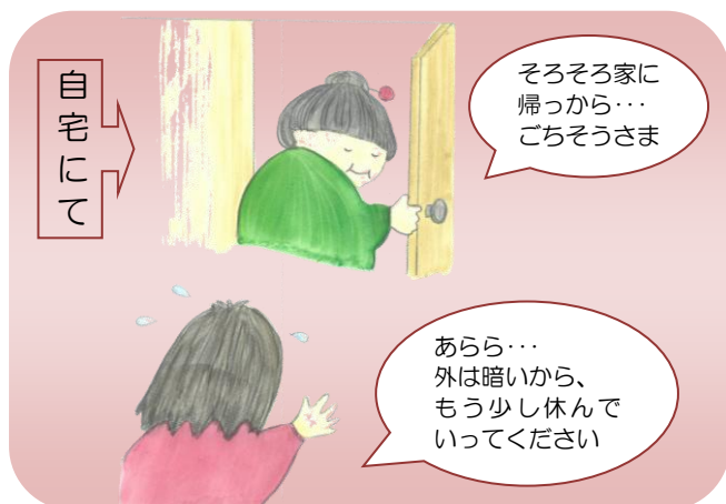
自分の家がわからない