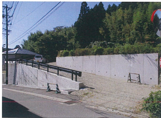
※物件入口(東側接道付近)