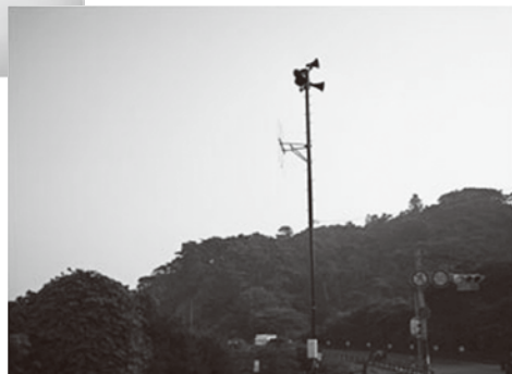
防災無線（屋外拡声子局）