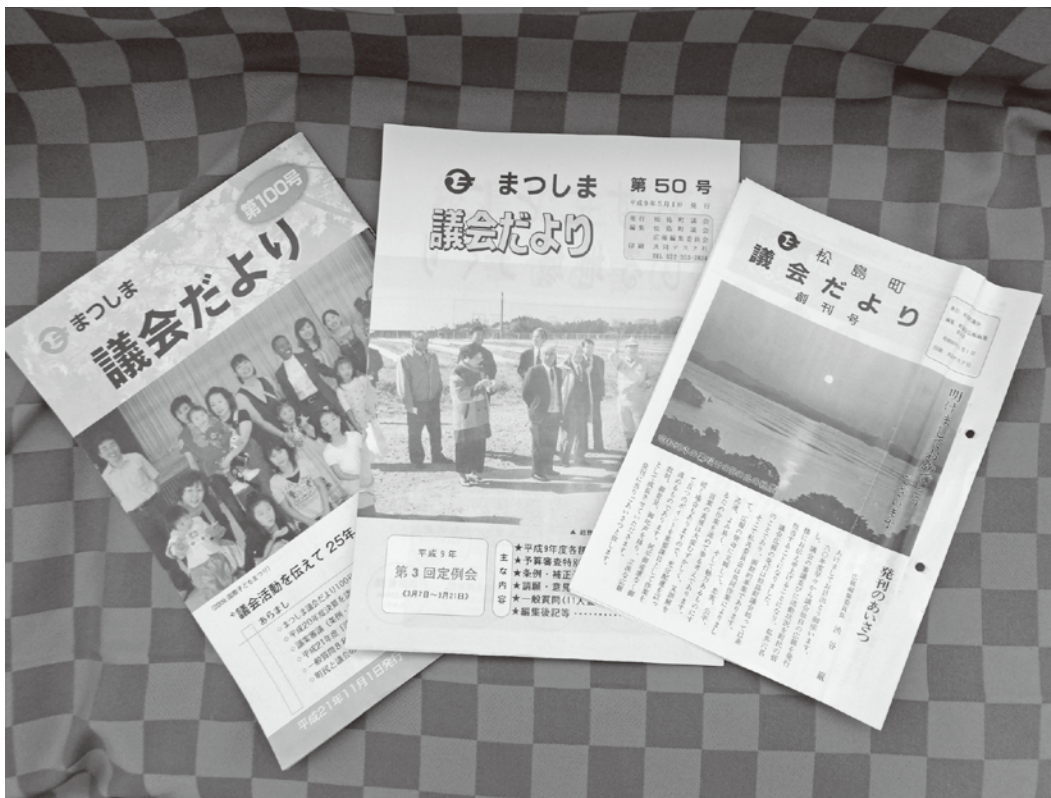
右から、創刊号(第1号)・第50号・第100号

議会だよりの配布活動に携わっていたいただいた行政区の方々に、心から感謝申し上げます。昭和60年から第1号が発行されて38年、議会