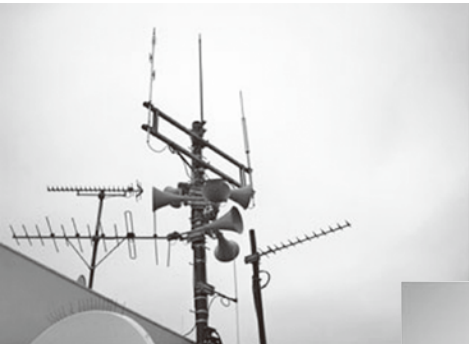
防災無線（役場屋上親局）

基金運用の新たな取り組みとして、安全で利率の高い共同発行債（共同発行市場公募地方債）を購入し、運用したことは評価に値する。世界情勢を考慮しながら今後の運用に努められたい。