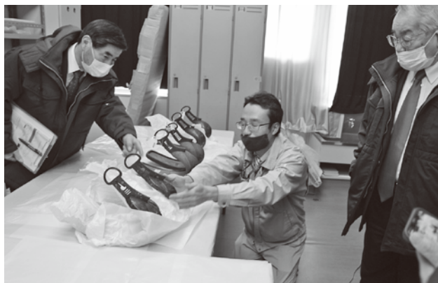
管理している「あぶみ」

学校教育班長 通学路安全点検において、学校から報告を受けた危険箇所については、道路管理者や警察と目視で合同点検を行った上で、看板設置等による対策で注意喚起している。 問 文化財は松島の歴史を語る上で非常に重要である。出土品を良い状態で保管し、展示等を含めた活用の状況は。 生涯学習班長 主に観瀾亭松島博物館で展示しているが、広報での紹介も含め、遺物や美術品を傷めることのないよう配慮しながら活用していく。