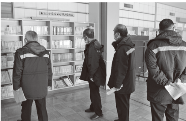
施設内の状況を確認（手樽地内）