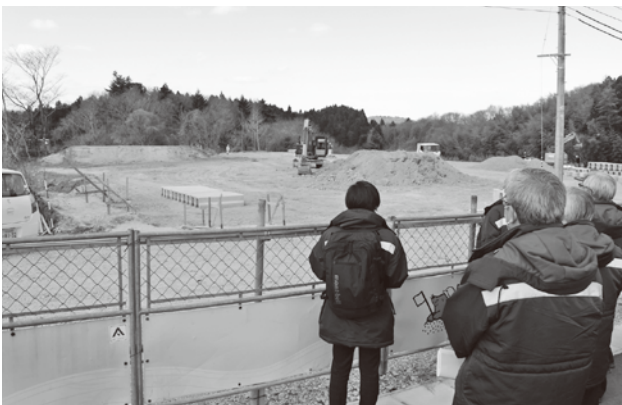
工事が着々と進んでいます（根廻地内）