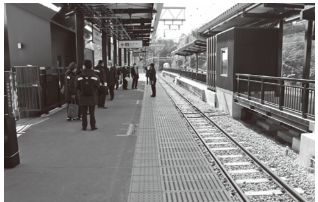
新しくバリアフリーとなった駅（松島地内）