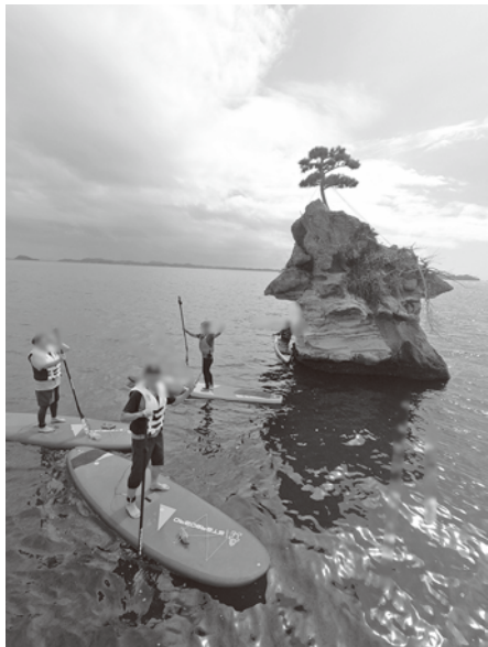
松島湾で楽しまれているSUP(サップ)体験

町長 サップにしてもシーカヤックにしても真剣に取り組むのであれば仙台港湾事務所や海上保安庁などの指導を仰ぎ一定のルールを敷いてそこに罰則的なものを設けることが今後必要なのかと思う。