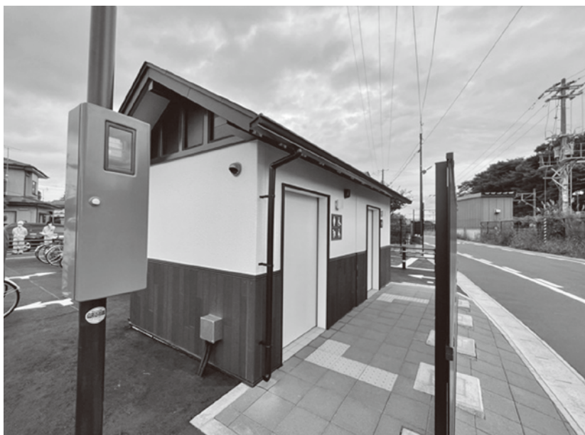
高城町駅前の公衆トイレ