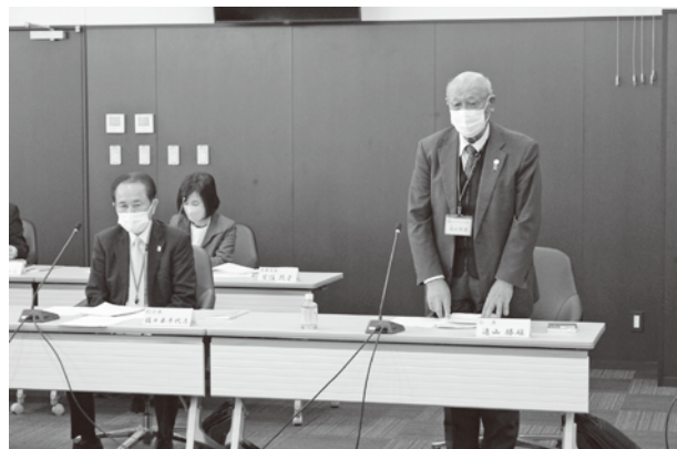
遠山会長より説明を受けました