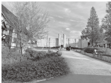
ブリティッシュヒルズ (福島県天栄村)

町長 騒々しきから少しかけ離れた静かなところで、広い土地が必要であり、そういったところにそういったものが溶け込めないのか思っている。展開はしていない。松島にある東京エレクトロンの保養所に通訳ブースが入っている国際会議ができる場所がある。子どもたちに実際に英語で体験してもらうことにより、夢が広がる施設が松島にあるので、見学等も今後考えてみたい。