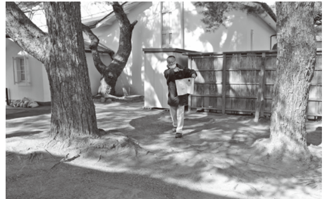
トイレ設置場所の説明を受けました