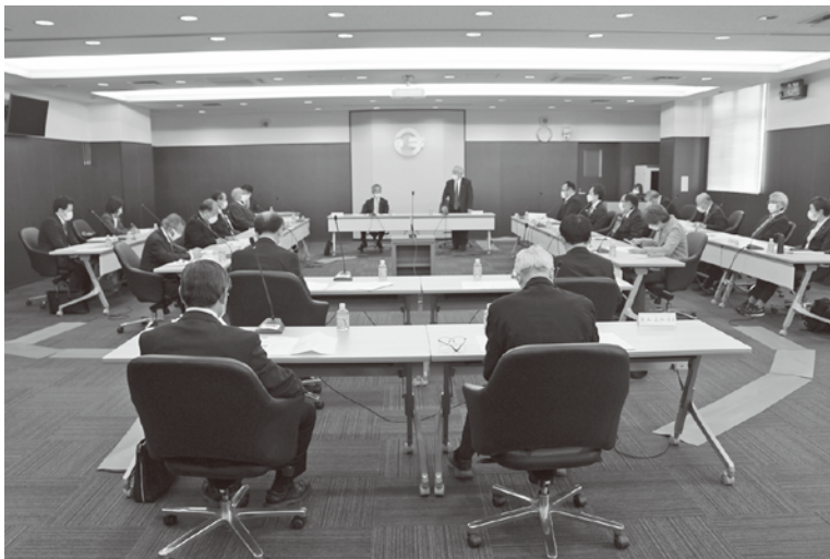
議長が座長を務めました

令和4年3月30日（水）、一般会議を開催しました。認定こども園「松島めぶぎの森」の工事等の進捗状況や園の在り方について、松島町社会福祉協議会から説明を受けました。詳細は、次号151号（8月1日発行）でお知らせします。