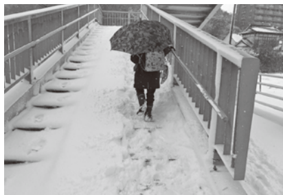
松島第二小学校前歩道橋

教育課長 積雪があった場合、学校内については、教員・業務員などが雪かきや融雪剤散布の除雪作業を実施している。