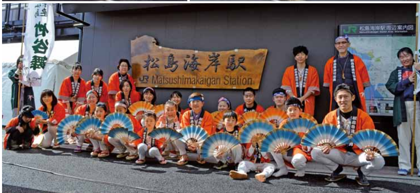
松島海岸駅リニューアルオープン 松島祭連竹谷舞のみなさんがすずめ踊りを披露