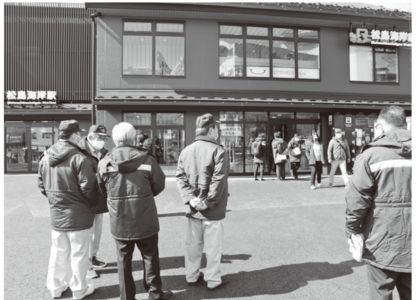
松島海岸駅（現地調査時のもの）