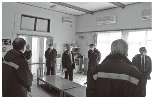
管理状況を確認（高城地内）