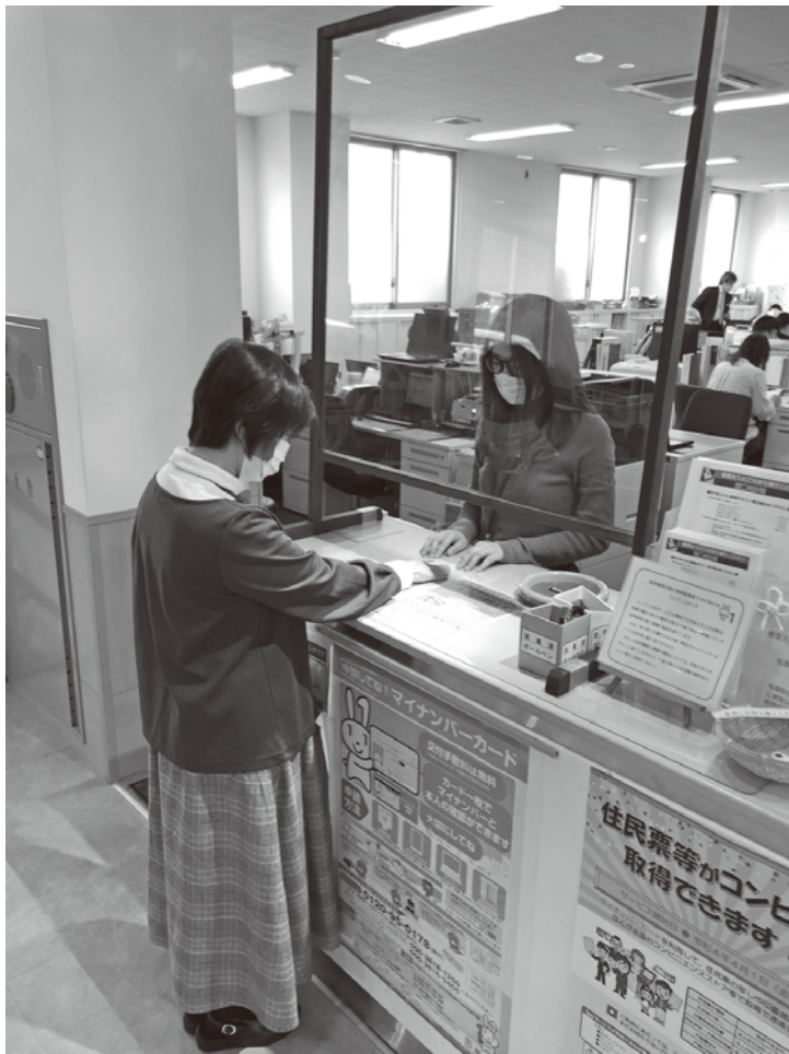
窓口での対応の様子

町民福祉課長 通常は、 転出する場合申請書記人 のうえ、転出届を転入先 の市町村へ持参するが、 マイナンバーカード保持 者は、スマホ、PCから アクセスし、転出予約が できる。その後マイナン バーカードを提示により 確認され転出が完了する 流れとなる。