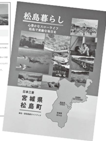
町の移住・定住PRサイトとパンフレット

マイナンバーカードの付与などにより、町民のマイナンバーカード取得への関心は高い。マイナンバーカードがスムーズに取得できるような環境整備を望む。