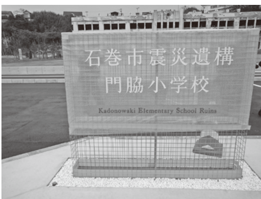
石巻市震災遺構 門脇小学校

町長 教育委員会等で、子供たちが向いて勉強すると伺っている。町民の方々も何らかの機会があれば見て頂きたいと考える。