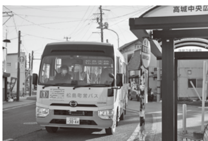
高城中央広場停留場

乗りやすい車両や環境面に配慮した車両は、5年サイクルでリースしており、今後財源の面も含めて検討していく必要があると考える。