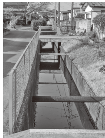
松島郵便局付近の雨水路（高城字町東二）

館脇を走る水路など9路線。それ以外にも土砂が堆積しているところがあれば予算の範囲内で実施している。 問 左坂配水池建設の進捗状況は。建設にあたっての進入路は。 水道事業所長 左坂については、設計、用地買収、施工業者の入札を終了している。完成見込みは5年度末である。仮設で進入路を確保しながら計画している。