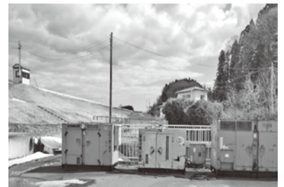
貝殻塚2地区の仮設ポンプ場

揚程に。②ホースを水抵抗の少ないものに。③水中ポンプ全てを稼働できる発電機の整備という要請だが現状は。