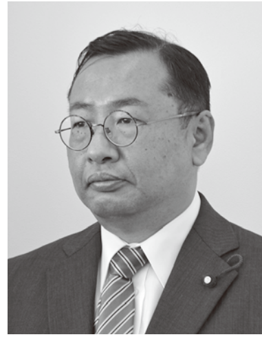
さくら い やすし 櫻 井 靖 議員