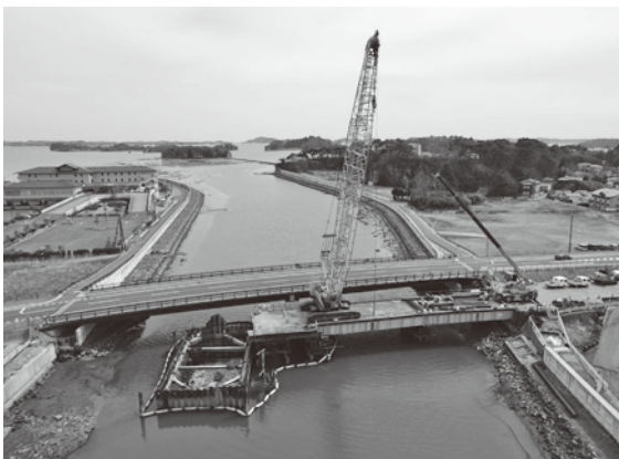
解体中の旧松島大橋