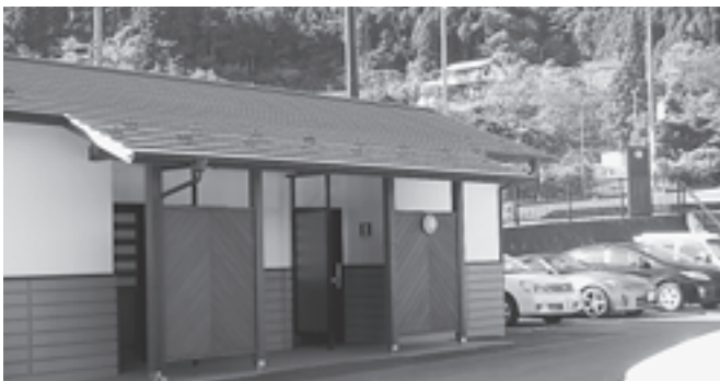
三十刈地内バリアフリー公衆トイレ建築工事