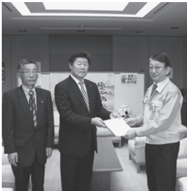
10月31日に宮城県三浦副知事へ提出