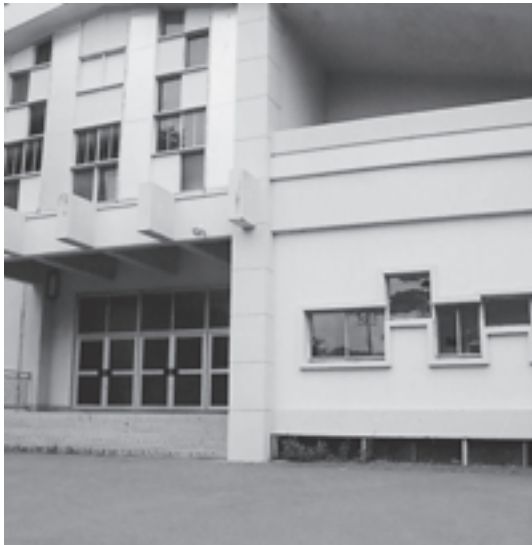
解体予定の町民体育館