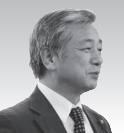
今野 章 議員 (一問一答方式)