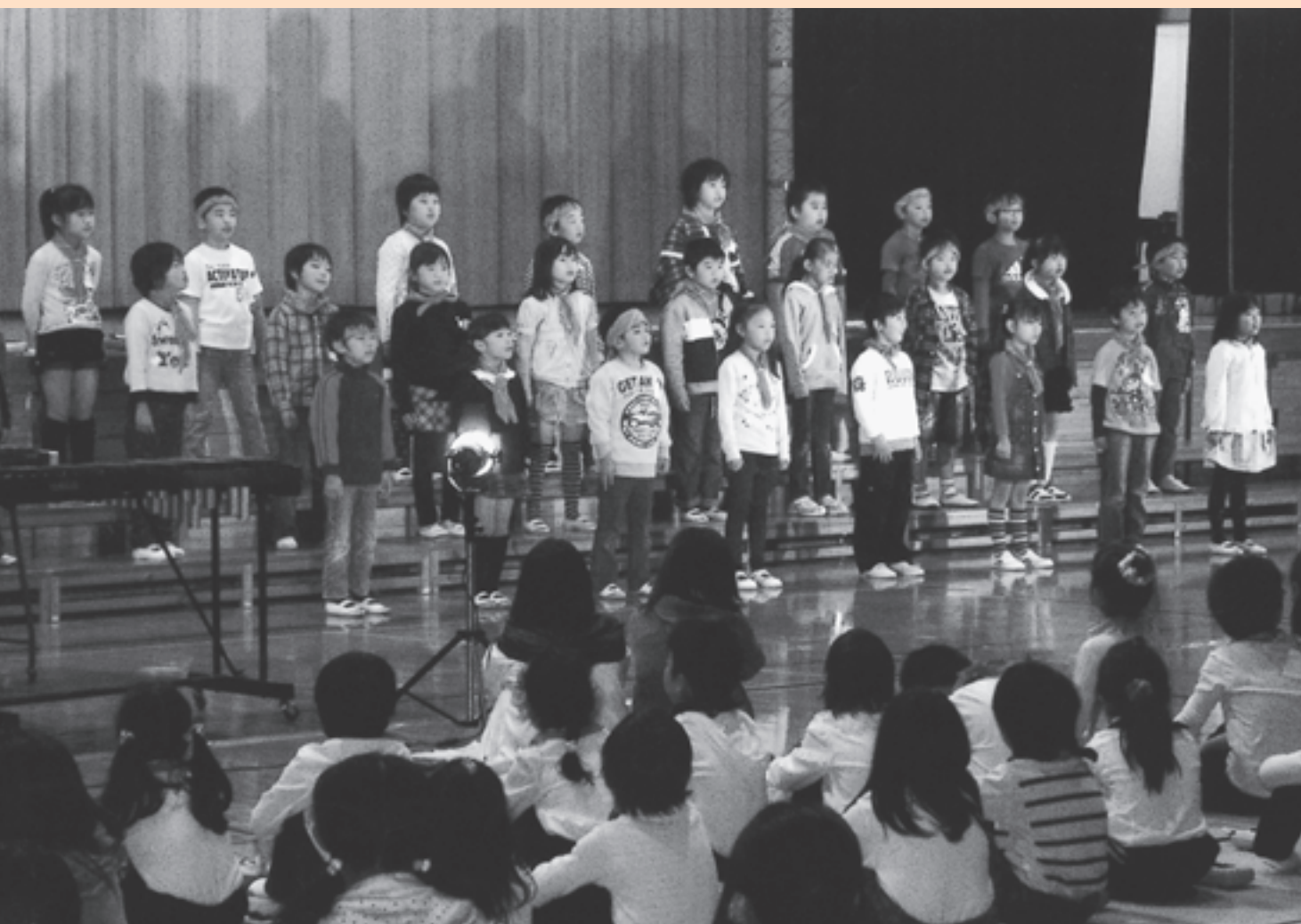
松島第二小学校 学習発表会