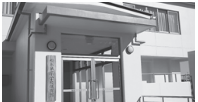
松島第一小学校体育館建設工事