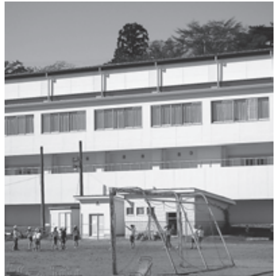
新設された松島第一小学校体育館