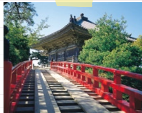
15:30 幸せを呼ぶといわれる3つの赤い橋(▶P.7)。 さあ、どの橋を渡りましょう?