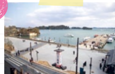
11:30 松島海岸に 到着!