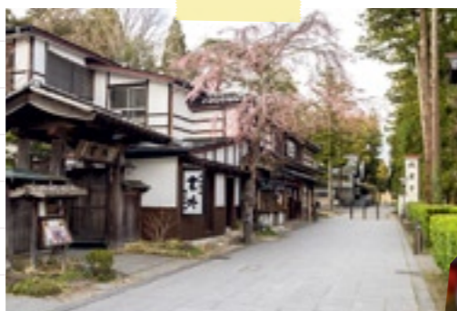
11:00 風情あふれる寺町(▶P.8)を散策。 甘味やテイクアウトメニューも 気になります。