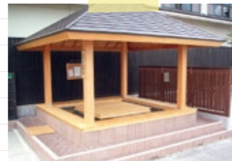
『太古天泉松島温泉 足湯』(▶P.14)も、 立ち寄りしたいスポットの一つ。 しっとり感のあるやさしいお湯が評判です。