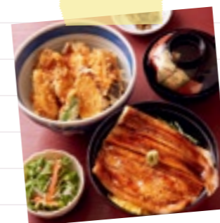
12:00 まずは腹ごしらえ。 松島といえばやっぱり海の幸。 穴子丼、お寿司、etc. 何にしようか迷ってしまいそう。(▶P.10)

観光名所に、地元グルメ。 松島らしさをめいっぱい楽しみたいから、 滞在は、松島温泉の宿でのんびり羽休め。 思い出に残るひと時を過ごしたら、 旅のお土産も忘れずに。