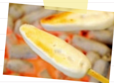
12:00 『松島蒲鉾本舗 総本店』(▶P.9)で 手焼きかまぼこ体験。 焼き立ての味は格別!