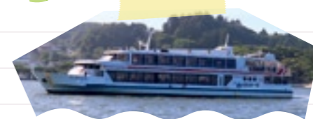
13:00 遊覧船(▶P.7)に乗って、松島湾をクルージング。 美しい島々の景色を前に、心も晴れやかに。