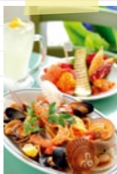
13:30 ランチは松島海岸駅近くの 『松島イタリアンToto』(▶P.11)で。 旅の余韻に浸りながら、 帰宅時刻まで惜しみなく。