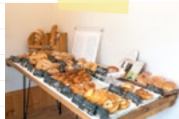
10:00 人気の『ぱんやあいざわ』(▶P.10)で お目当てパンをゲット。