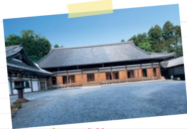
9:00 伊達家の菩提寺、瑞巖寺(▶P.7)を拝観。 偉大な伊達政宗の功績にも 思いをはせるひと時。