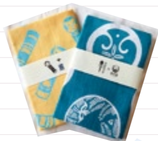
13:00 通りを歩いてお土産探し(▶P.12)。 雑貨、お菓子、お酒など、 松島ならではの 商品に目移り。