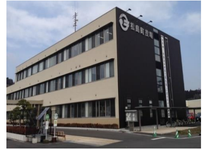
松島町役場本庁舎