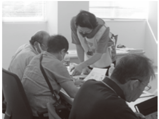
▲スマートフォン教室を 実際に受けている様子