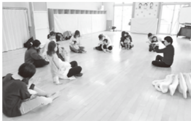
▲ディスカッションイメージ