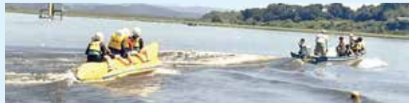
▲バナナボートに乗るためにはバランス感覚が必要です