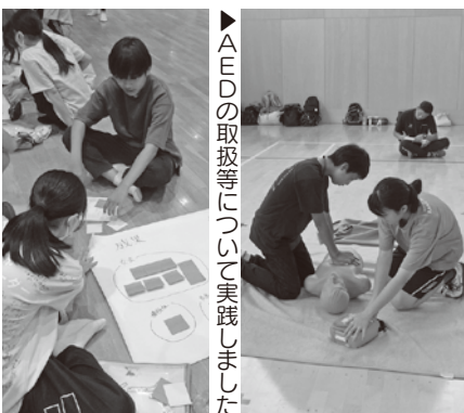
▶AEDの取扱等について実践しました