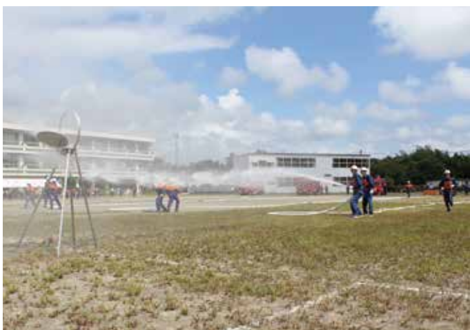
▲小型ポンプ操法の様子