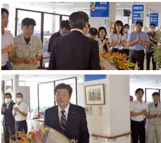
◀初登庁の際の様子

先代が築き上げたこれまでの本町の歴史や文化を継承しつつも、変化を続ける社会経済情勢に決して立ち止まることなく、柔軟な行政運営を展開し、時代に取り残されることのない、常に進化をつづけるまちづくりにより、新たな松島を創造し、これからの時代を担う若い世代に松島を繋げるよう、各政策を展開してまいります。