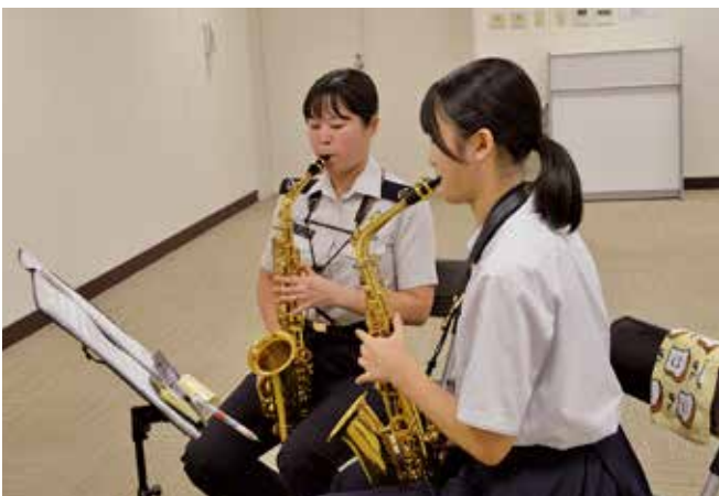
▲音楽指導を受ける様子