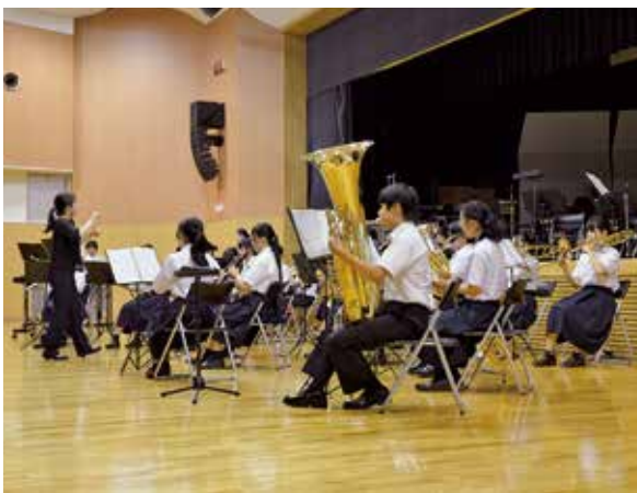
▲松島中学校吹奏楽部による演奏