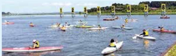
▲カヌーをまっすぐ進ませるにはパドル操作が大事です

マリンスポーツの魅力を体験してもらうイベントが4年ぶりに登米市の長沼ボート場で開催され、町内の小学生が参加しました。