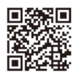
▲県ホームページはこちら