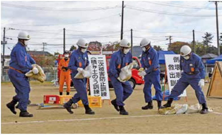
▲昨年度防災訓練の様子

総合防災訓練は、災害対策基本法や町の地域防災計画に基づき、大きな被害をもたらす地震発生時の応急対策を迅速かつ的確かつ総合的に実施できるよう各種訓練を行うことにより、防災体制の強化を図ることを目的とします。