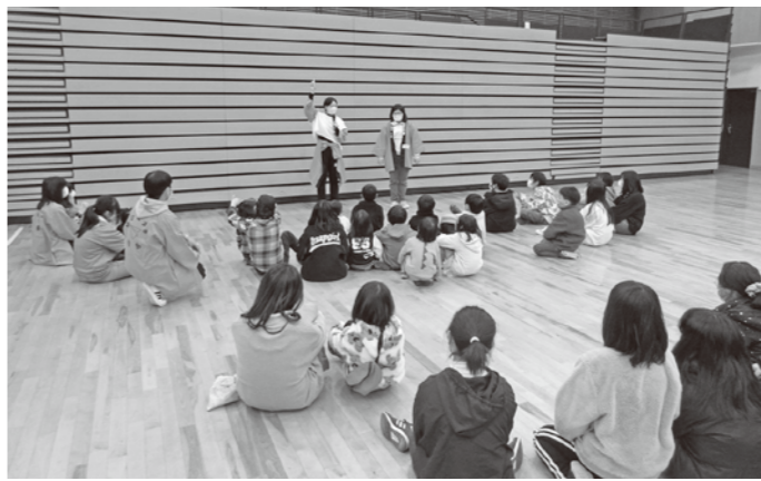
▶松つまつりでは、各回たくさんの子供たちと触れあうことができました!

また、同26日の松つまつりでは、のべ128人の未就学児・小学生と身体を動かすゲームや手遊びで交流しました。中には、何度もブースに来てくれるリピーターの姿も。中1メンバーも先輩たちに助けをもらいながらゲームのルール説明に挑戦するなど、1年間の成長が見られた活動となりました!