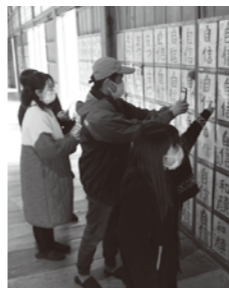
▲瑞巖寺本堂に展示された作品

本イベントは、書道を通して子ども達の落ち着いた心と健やかな成長の一助となることを目的に開催しており、昨年に引き続き2回目の開催となりました。