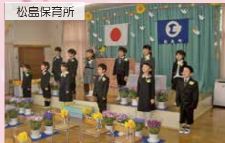
松島保育所 松島第二幼稚園 高城保育所分園