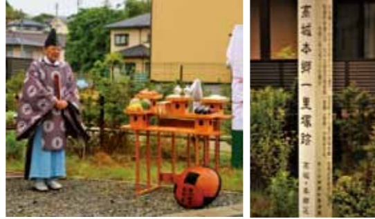
▼除幕前に行われたの神事の様子 ▼建立された標柱

6月26日、高城本郷一里塚跡に建立した「日本橋より百里目の標柱」の除幕式が行われました。高城区本郷区、おくの細道松島海道の皆さんが寄贈したもので、式典には関係者20名が参加しました。この一里塚は約400年前に高城守水溜上に整備され、江戸日本橋より百里目にあたります。平成初期まで街道の両側に残されていたが、工事のため撤去されてしまいました。今回建てた標柱の表面には「高城本郷一里塚跡」など刻まれています。