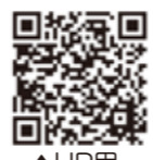
▲HP用 (松島ファンクラブページ)