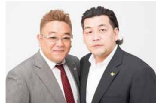
伊達みきおさん（左）、富澤たけしさん（右）