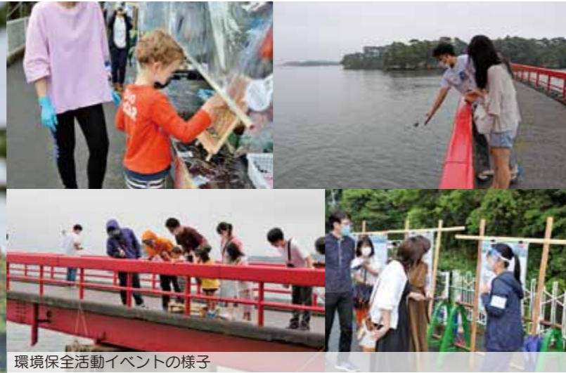
環境保全活動イベントの様子

新型コロナウイルス感染症対策として制限されていた、県をまたぐ移動の自粛が緩和されてから、少しずつ町内でもイベントが開催されはじめました。8月9日には福浦橋でNPO法人環境生態工学研究所による環境保全活動が行われ、福浦橋を訪れた観光客に泥状の底質を改善するための砂団子を海に投げ入れられました。少しずつですが、海草（アマモ）が繁る海をめざし、豊かで美しい松島湾を後世に引き継ぎます。