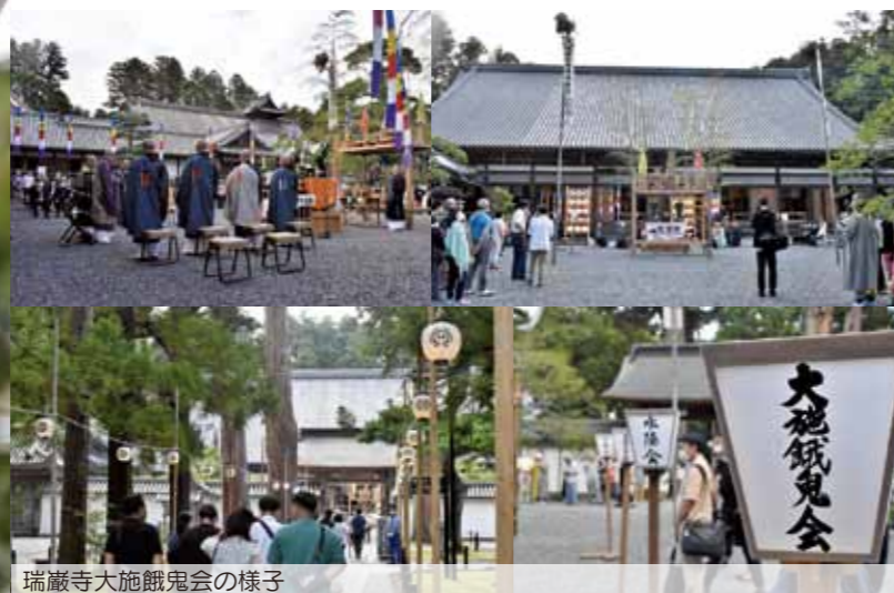
瑞巖寺大施餓鬼会の様子

そして、コロナ禍で訪れた「特別なお盆」。この期間に行われる予定だった多くのイベントは県内外からの観光客が訪れることが想定されたため、中止されましたが、規模を縮小して開催されたのが8月16日の「瑞巖寺大施餓鬼会」。例年と違い、瑞巖寺本堂前庭で厳かに行われました。訪れた方の中には自分のご先祖様の供養だけでなく、世界的な新型コロナウイルス感染症の終息を祈願している方も見受けられました。