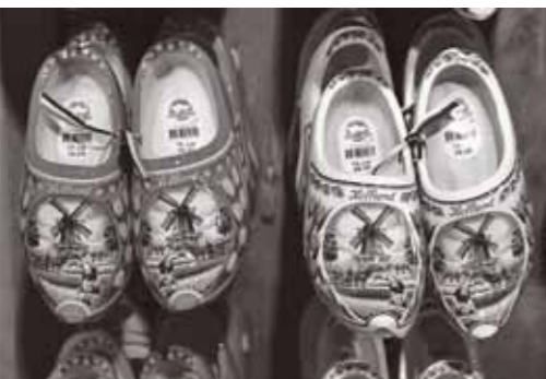
▲オランダの伝統工芸品「木靴」

個人的な考えですが、歌は世界中の人々の心を魅了し続けていると思います。わたしはNHK紅白歌合戦と、童謡の「どんぐりころころ」について聞いた時、日本には各都道府県の歌があり、対戦するのだと驚いていました。たくさんの方々のようなコンテストがあります。もし、宮城県が歌のコンテストで他の都道府県と競うことになったら、皆さんはどの曲を推薦しますか？宮城県にゆかりのあるアーティストの曲ですか？