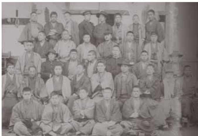
▲②帝國少年議會松島支部發會式集合写真