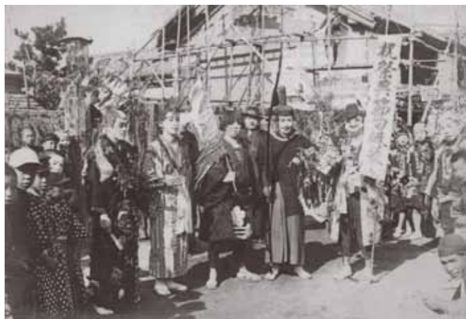
▲①高城町祭礼の様子