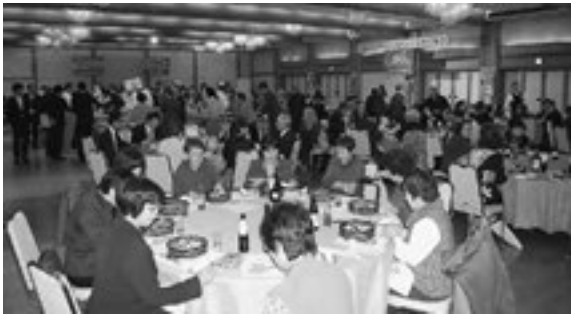
▲今年も大盛況だった「てんこもり賞味会」