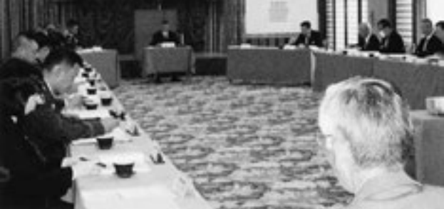
▲松島で開催された自衛隊父兄会東北協議会

10月22日、新富亭で自衛隊父兄会東北地域協議会が開催され、東北各地域の自衛隊父兄会の方々や、自衛隊関係者が出席しました。