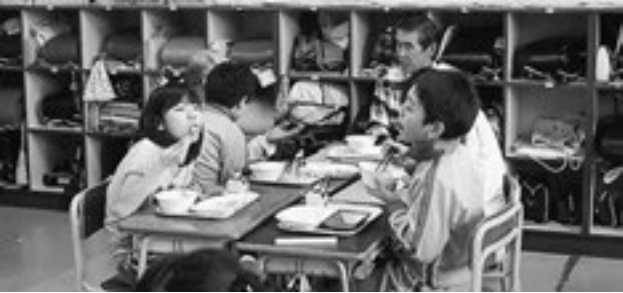
▲生産者の方と一緒に給食です

11月18日、町の食育推進の一環として、学校給食に野菜やみそなどを供給している生産者と松島第二小学校の児童の交流会が行われました。児童は、生産者から野菜づくりの取り組みなどを聞いたり、栽培方法を質問したり食の大切さを学びました。