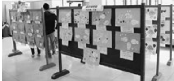
▲力作が多く展示されました