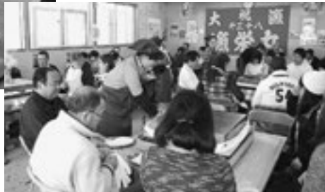
▲開店と同時に満席となりました