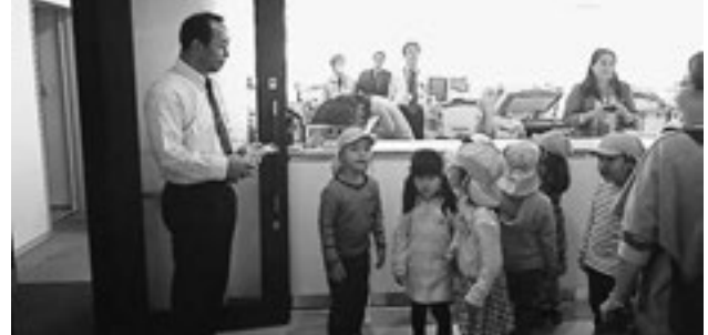
▲役場を訪問した児童たち

来年の干支「申」のカレンダーやカード立てを手作りした子ども達。日頃お世話になっている方々の職場を訪問し「いつもお仕事、ありがとうございます」と感謝の気持ちを込めて、プレゼントを届けてきました。訪問先の皆様からも「ありがとう」の声をかけていただき、子ども達も「よかった」と大満足でした。