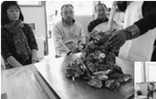
▲スコップでかきをアツアツ鉄板へ