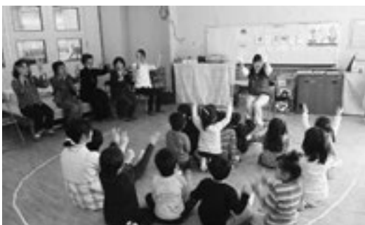
▲手遊びも取り入れて盛り上げました