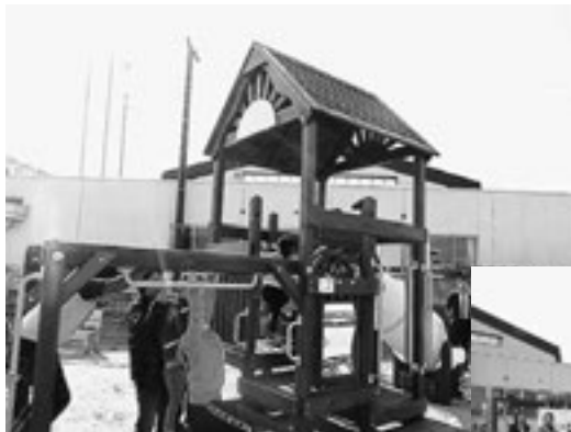
▲寄贈された屋外遊具

オープニングイベントでは、ハンバーガーやチョコレートファウンテンがレイサム&ワトキンス社やPoHのご厚意で用意され、設置されたばかりの屋外遊具で大勢の子ども達が楽しく遊びました。