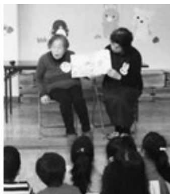
▲真剣に聴く子どもたち