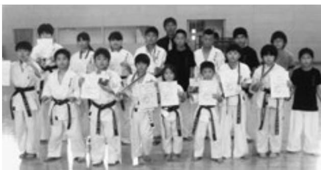
▲空手大会で活躍した皆さん

以上の方は来年4月に開催される POINT&K.O 全日本選手権大会に出場します。