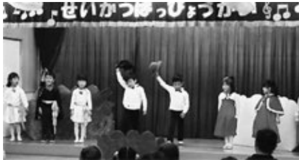
▲ポーズも決まりました

年長クラスはオペレッタ「北風と太陽」を発表。表情豊かに演技をしていました。また、保護者さん方による「二人羽織」も披露され、会場内は笑いに包まれるなど楽しい1日となりました。