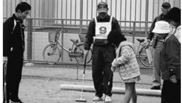
▲はじめてのゲートボールを楽しみました

11月7日、松島ゲートボール協会の方々や小学生や保護者、松島高校ボランティア部の皆さんが参加して、ゲートボール大会と芋煮会が開催されました。