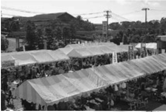
▲多くの人で賑わったまつしま産業まつり

お子さんやお孫さんに絵本の読み聞かせをしてあげたいと集まった21人の参加者の皆さんは、3回の講座でそのノウハウや手遊びなどを学びました。第二幼稚園で11月10日に行われた実習では、講座と積み重ねた練習の成果を発揮し子どもたちを楽しませました。