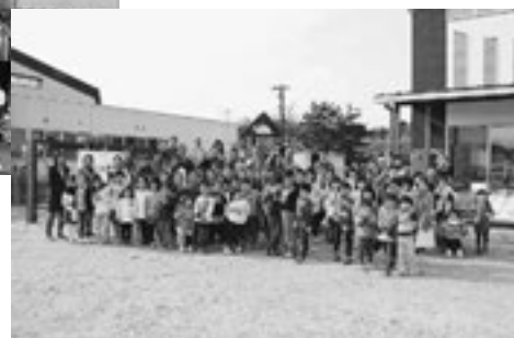
▲みんなで記念写真です