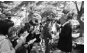
▲円通院の歴史を教えてくださいました

10月28日と11月4日に、松島第五小学校6年生が松島四大観と町内の史跡めぐり（円通院、天麟院、観瀾亭など11ヶ所）、富山大仰寺で座禅体験を行いました。児童の皆さんは「町内に住んでいても訪れたことがない場所が多かった」、「来たことはあるがどんな歴史がある場所なのか知らなかった」とふるさとの歴史にふれる二日間になりました。