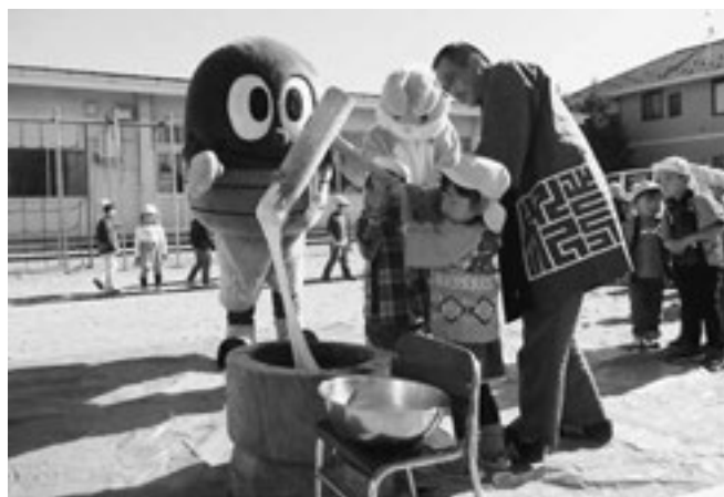
▲みんなで協力してもちつきを行いました

お昼には子どもたちは「やわらかいね」「おいしいね」とつきたてのお持ちをみんなで味わいました。