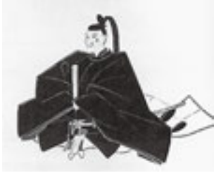
▲伊達綱村画像 無明禅師筆(仙台市博物館所蔵)

またある時は藩の製塩場があった高城へ、ある時は天気の良い日を選んで富山へ、というようにあちこちへ、と出歩いており、松島を堪能する綱村の姿がうかがえます。(学芸員：本木)