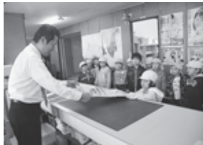
▲高城保育所の子どもたちからカレンダーをいただきました