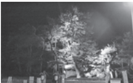
▲観瀾亭の大ケヤキもライトアップ