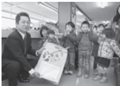
▲希望園の子どもたちからカレンダーをいただきました

保育所や希望園の子どもたちから町へ「いつもみんなのためにお仕事がんばってくれてありがとうございます」と、カレンダーやペン立てなど、心のこもった手作りプレゼントをいただきました。