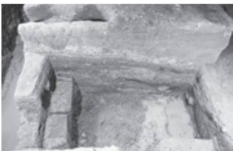
▲寄生虫の卵が確認された穴