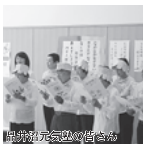
品井沼元気塾の皆さん