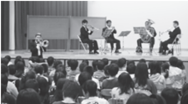
▲一流の演奏で芸術の秋を堪能

子どもたちは、トランペット、トロンボーン、ホルン、チューバといった金管楽器の一流の演奏を楽しみ、芸術の秋を堪能しました。