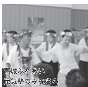
高城ふれあい元気塾のみなさん