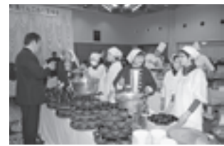
▲松島の食材を使った数々の料理がふるまわれました