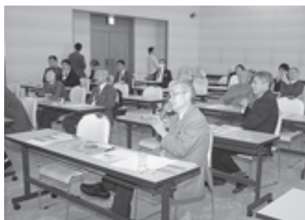
▲活発な意見交換が行われました

行われました。 この講演会は、松島町が震災復興計画に盛り込んだ「ジオパーク」についての理解と可能性を探るために開催されました。