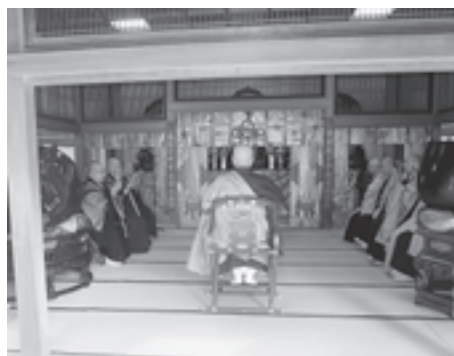
▲陽徳院で開催された芭蕉祭