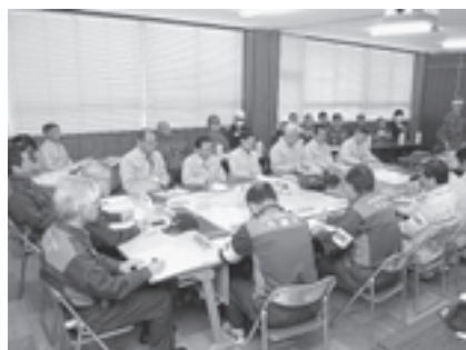
▲各機関が集まり、対応を協議する災害対策本部