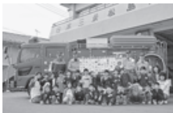
▲カッコいい消防車の前で「はいチーズ」

子どもたちは、いつも松島のために働いてくれている消防署の皆さんに、感謝の気持ちを込めてみんなで描いた絵をプレゼントしました。 また、子どもたちは消防車や救急車を見せてもらい、目を輝かせながら消防署の仕事についてお話を聞いていました。