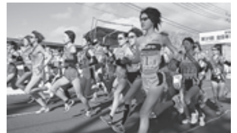
▲ 昨年の大会の様子

大会コースは、松島町中央公民館前をスタートし、仙台市までを結ぶ42.195 kmです。各チームの選手がたすきをつなぎゴールを目指します。