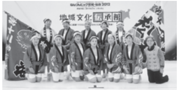
▲松島の前進を目指し、心を込めて一生懸命踊りました

地域文化伝承館は民俗芸能や郷土芸能の伝承を通じて世代間交流を図る目的で開催されており、ステージ出演の部では、松島町老人クラブ連合会女性部の皆さんが「大漁唄い込み」を披露しました。