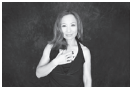
▲ 今回の旅人 八神純子さん