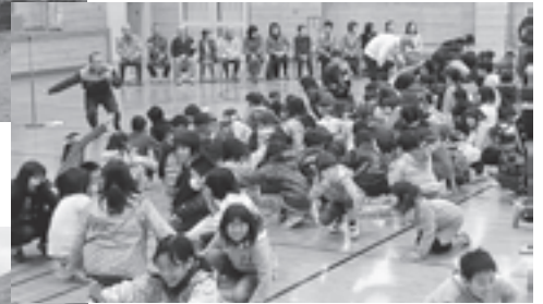
▲第二小学校で行われた講話の様子