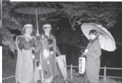
▲伊達武将隊も来松