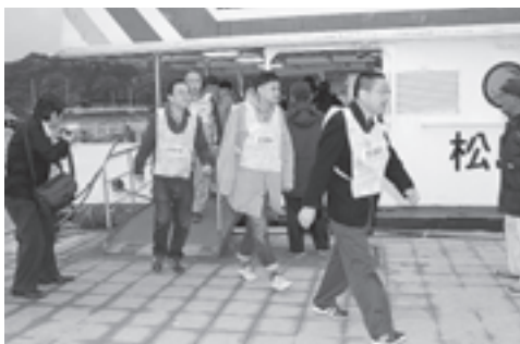
▲出航していた遊覧船から避難

訓練は、観光棧橋付近、五大堂付近に観光客が多数いて、さらに遊覧船が出航している状況で、さらに、福浦島には観光客が取り残され、福浦橋が落橋する恐れがある状況を想定。福浦島では、海上保安庁がへりから取り残された観光客への呼びかけ、自衛隊による避難誘導など、より実践に近い形で防災訓練が展開されました。