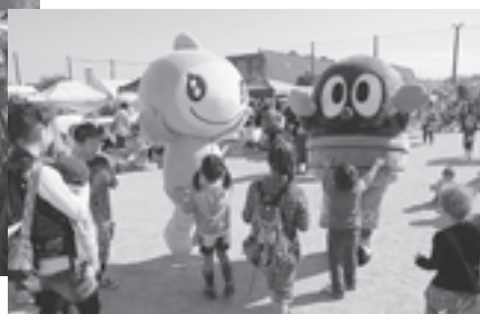
▲ターナちゃんとどんぐり松っちゃんの共演