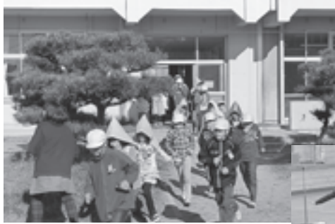
▲第一小学校で行われた避難訓練の様子