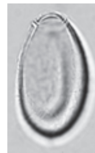
▲遺跡から採取した土に含まれていた肝吸虫の卵