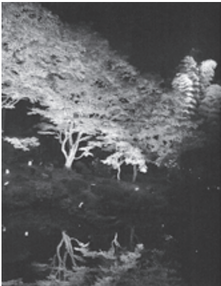
▲ライトアップされた紅葉が池の水面にきれいに浮かび上がりました

さらに、滑川町のイメージキャラクターのターナちゃんと本町のどんぐり松ちゃんが会場で共演。訪れた子どもたちと一緒に記念撮影をするなど、会場は大盛況でした。