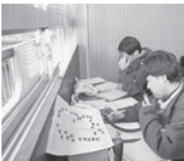
▲各地区から次々と情報が入ります

役場庁舎では、地震発生と同時に災害対策本部を設置。陸上自衛隊や海上保安部等の関連機関、各種団体等が一堂に会し、各地区へ配置した職員から入る被害状況、避難者情報などをもとに、迅速な初動体制について確認しました。またいつ来るかもしれない大震災。町全体が一体となった訓練は今後も必要です。