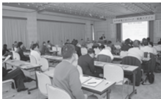
▲観光関係者、教育関係者、地球科学関係者など約50人が参加

講演後に開催された、地球科学関係者と地域住民との意見交換では「松島の地質と歴史性を生かすことは可能か」「ジオパークに認定されるためにはどのような組織が必要か」など、活発な意見交換が