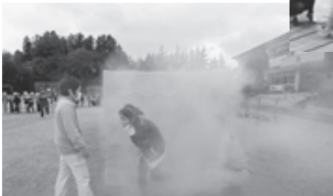
▲第五小学校で行われた濃煙体験訓練の様子