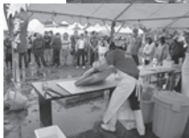
▲マグロの解体ショーも大盛況