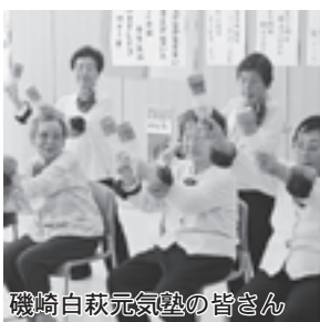
磯崎白萩元気塾の皆さん

10月17日には、4カ所の塾生が保健福祉センターどんぐりに集まり、脳トレや体操、活動発表等を行い、交流を深めました。