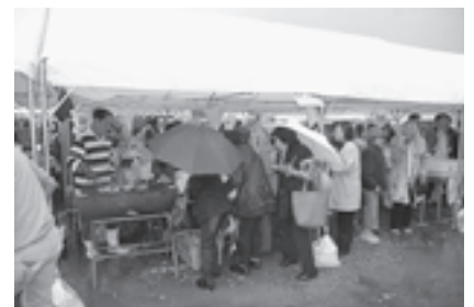
▲たくさんの店舗が会場に並びました