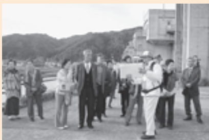
▲ガイドさんから震災当時の話を聞く委員の皆さん

岩泉町は、沿岸部の河口に設置された高さ12mもある水門を津波が越えて町を襲い、80棟もの住宅などを押し流しました。地元のガイドさんの説明で、水門の建設や今回の津波被害について、また、この震災を風化させないよう自分たちが伝えていこうという話しに、参加した委員の皆さんは共感。「災害を受けて困ったときは、お互い助け合い、乗り越えないといけない」と感想を語っていました。