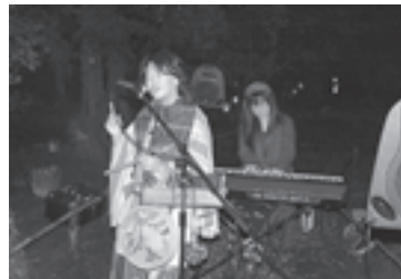
▲アンデス音楽の演奏が幻想的な雰囲気を作り出しました