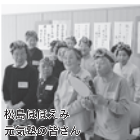
松島ほほえみ元気塾の皆さん