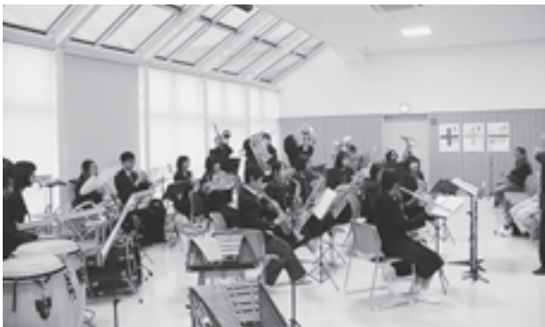
▲松島中学校吹奏楽部による演奏

毎年開催されているこのコンサートは、今年で20回目。今回は町内の音楽団体から7団体が参加し、美しいハーモニーの合唱や壮大な吹奏楽の音色に、会場の皆さんは魅了されていました。