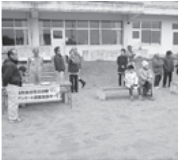
▲手樽地区での避難訓練の様子

町内の各行政区では、それぞれの地区の住民が避難所に避難。安否確認や防災訓練でのアンケートを実施するなど、各地区でさまざまな訓練が展開されました。