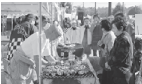
▲行列ができるほど大盛況だった焼ガキ