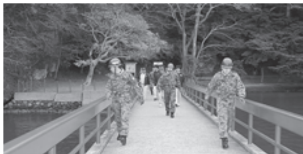
▲自衛隊による避難誘導