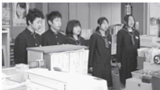
▲役場総務課であいさつをする松島中学校の生徒の皆さん

11月15日と16日に松島中学校の2年生が、松島町役場をはじめとする町内の43の事業所で職場体験を行いました。 生徒たちは、実際に働く人に触れることで働くことの意味ややりがいなどについて見識を深め、自分の将来へ関心を高めていました。 今後は、職業調べや上級学校調べなど自分たちの将来についての学習を深めていきます。 ご協力いただいた事業所の皆さま、ありがとうございます。