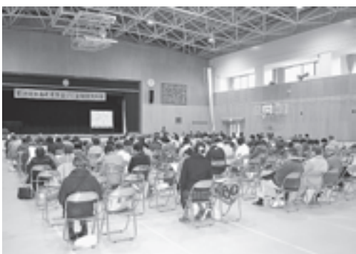
▲全国俳句大会には多くの俳句愛好家が集まりました