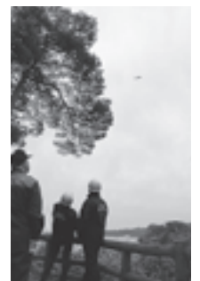
▲へりから観光客へ呼びかけ