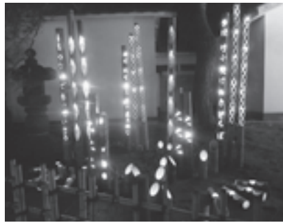
▲～絆～プロジェクトおおむたによる演出