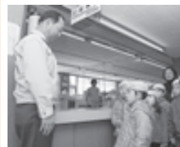
▲磯崎保育所の子どもたちからペン立てをいただきました