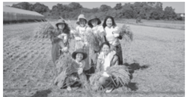
▲元気なお米ができました

「いやすこ」は、松島の農業、酒造、酒屋、ホテル等の人たちで作りあげるお酒。今年は、首都圏在住の方がたなどで結成された「いやすこ作り隊」も5月の田植えから参加し、冬には初しほりを行います。