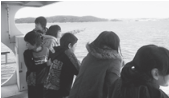
▲学区を越えて一緒に松島湾周遊を楽しみむ児童たち

児童たちは口々に「きれいな海だね」と話し、自分たちが住んでいる松島の良さを実感した一日となりました。