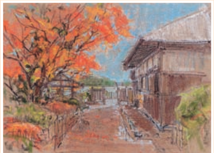
▲もみじが色づく頃の観瀾亭

定は豊 は歴んさ 所亭主呼別 た宗い江臣仙二 さ、か床にのかを観ざ代歴)吉ば名歴とがたの戸秀台室 れ国にのかが肌瀾ま藩)と(別村れ一代伝現もの藩か祖ら て重描間がでで亭な主名に公お見のれ場二のをに讓達なる い要かやでで表がざより殿休て所代移政宗茶 ます。文れ襖し感で表がざより殿休て所代移政宗茶 。化たによじ、情松され波り、殿息いに藩築受が、豊 。財障極か。み久楽湾を「五」息いに藩築受が、豊 に壁彩か。てのしのた。観観瀾瀾も、す。し忠、 指画色。てのしのた。観観瀾瀾も、す。し忠、