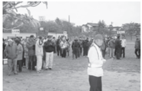
▲高城地区での避難訓練の様子