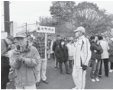
▲磯崎地区の避難所で行われた安否確認