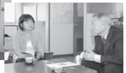
▲「いただいた提案を観光振興計画の改訂に反映させていただきます」と大橋町長