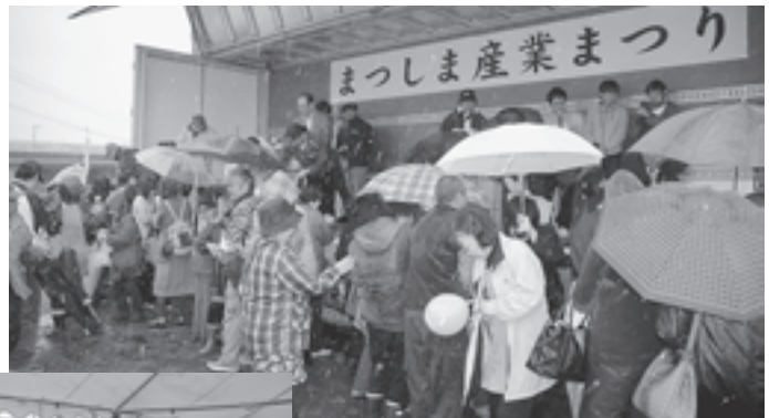
▲盛り上がった恒例の餅まき大会