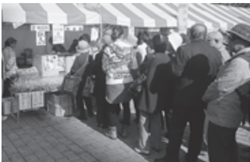
▲かき鍋を待つ大行列

松島産のかきを使った白だし風味の鍋は好評で、順番を待つ行列ができるほどの盛況ぶりでした。ブースでは鍋のほかに、かきご飯や松島トマトも販売され、松島の地元食材のPRも行いました。