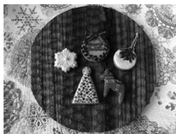
▲大人用サンプル画像

アイシングをカラフルに着色し、クッキーに絵やメッセージを描いたりデコレーションします。クリスマスに向けて、可愛いアイシングクッキーを作りましょう。乾燥させると表面がしっかり固まるので、持ち歩きもしやすく、プレゼントにもぴったりです。