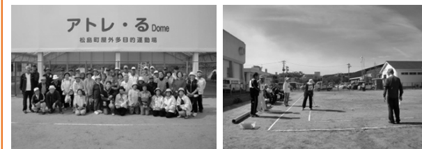
▲ゲートボール協会の皆さん