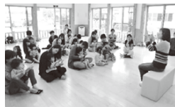
「読み聞かせの会」 絵本の世界と、手あそび を楽しみました!