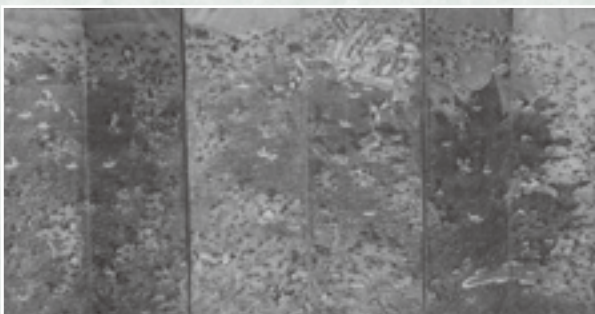
▲昔の松島の様子を見ることができます (松島全図景彩色屏風)

そのほか浮世絵風の松、京阪地方や瀬戸内に用いられた船、波の細かな筆致を見ることができます。