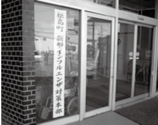
▶ 役場内に対策本部が設置されました

インフルエンザの様な症状がある方は、早めに宮城県の発熱相談センターにご相談ください。