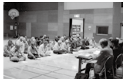
▲昨年の議会報告会の様子