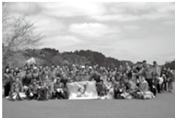
▲毎年多くの会員で清掃していただく「ぼうし会」の皆さん

今回で十一回目となった清掃活動には、会員や家族約百人が参加。全国から観光客が集まるゴールデンウィークを前にした四月十七日に、三十刈駐車場から国道四十五号の双観山付近までの道路沿いを歩き、ゴミや空き缶を拾いました。