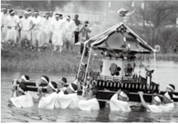
▲冷たい川の中を威勢よく担いでいました

また、途中で田んぼに入って泥だらけになって渡御したり、田中川では、水垢離をとる担ぎ手の健闘ぶりに、駆けつけた観衆から歓声があがっていました。