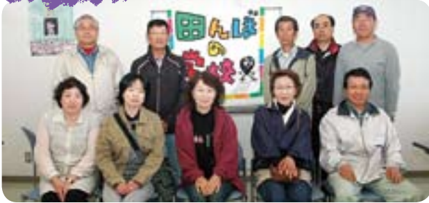
▲磯崎農事経営研究会の皆さん