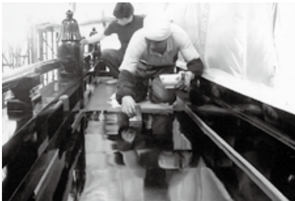
◀ 漆が丹念に塗られている様子