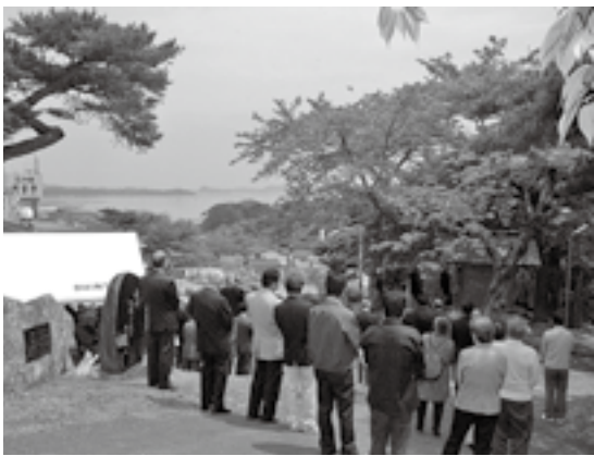
▲松島湾の安全を見守る金比羅社

金比羅社は、海上安全の守護神として尊崇されてきましたが、長年の風雨により姿形がなくなりました。平成十二年に同地域の水主衆の子孫や遊覧船関係者、漁業関係者などにより再建されました。