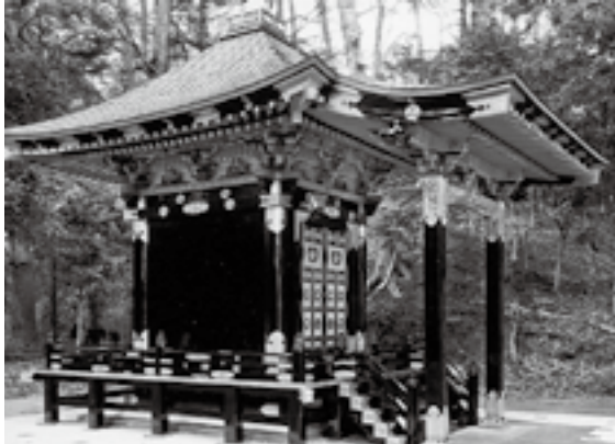
▶ 創建当初の姿に復元された「宝華殿」

※なお、「宝華殿」の公開は瑞巖寺本堂等の修理期間に合わせて九月一日からを予定しています。