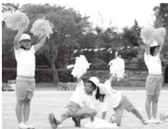
▶練習の成果を披露（第五小学校）