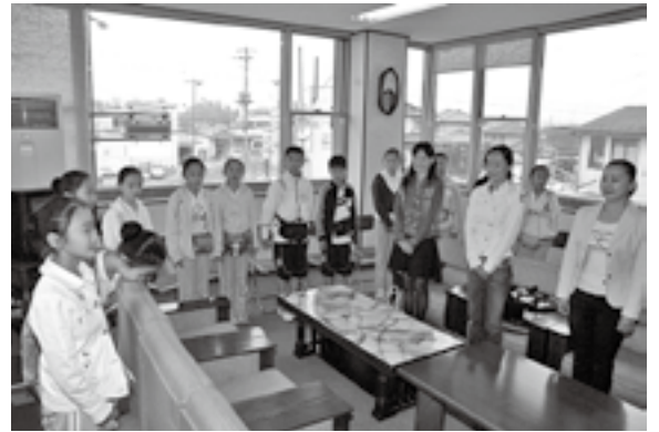
▲「松島は中国でも有名で訪れるのが楽しみでした」と話していました

田んぼの学校では、今後、ハウストマトの摘み取りや田んぼの生き物調査、鎌での稲刈り体験などを通して、食べ物の大切さや水田の機能などを学びます。