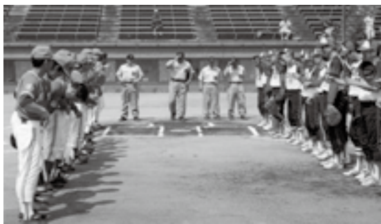
▲互いに熱の入ったプレーを!

発足十九年目を迎えた松島シニアチームも参加し若手顔負けのプレーで一、二回戦を完封で勝利。強豪宮城高豊ドリムズには敗北したものの見事三位入賞を果たしました。この大会には、県内より十六チームが参加し熱戦を繰り広げました。