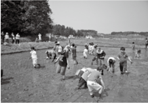
▲泥まみれでも楽しんで苗を植えました

また、もち米の他に古代米三種類も植えられ、子どもたちは早くも秋の収穫祭が楽しみの様子でした。