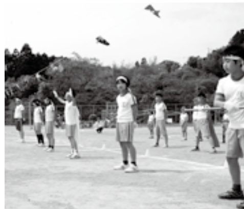
◀白熱した応援合戦（第二小学校）

五月十六日、二十四日に町内各小学校で運動会が開催され、児童は校庭を元気に駆け回っていました。 運動会では、徒競走や玉入れ、リレーなどの種目や組体操など各学校が趣向を凝らした演出が披露され、児童はもっている力を一杯出して競技に取り組んでいました。 また、父兄や応援団から選手に大きな声援が送られ、始終、歓声や拍手に包まれていました。