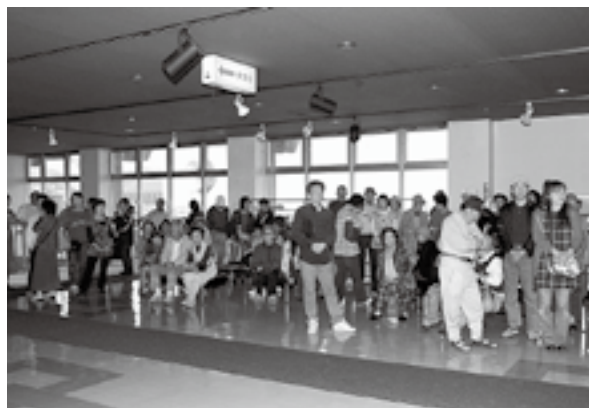
◀販売前から長蛇の列ができました

松島町商工会では、定額給付金の給付に合わせて、五月十日に中央公民館でプレミアム商品券の販売を開始しました。 会場には、販売前から商品券を買い求める町民などで長い列ができ、初日で七割が売れ五月十二日には用意した三千五百セットが完売しました。