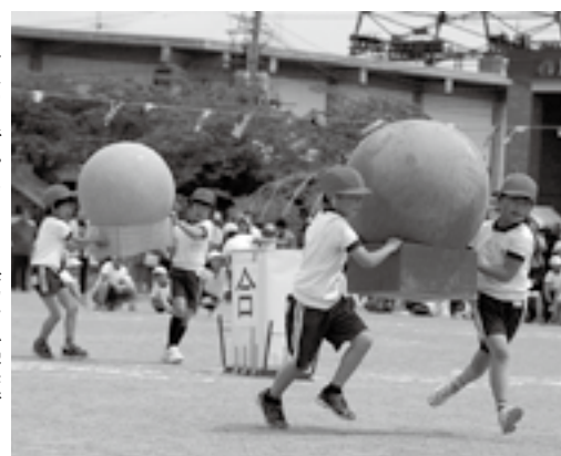
▶二人の息がピッタリ（第一小学校）