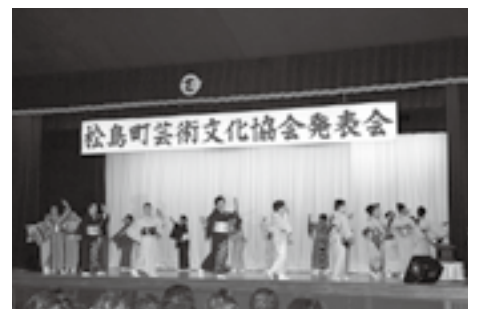
▲昨年の発表会の様子