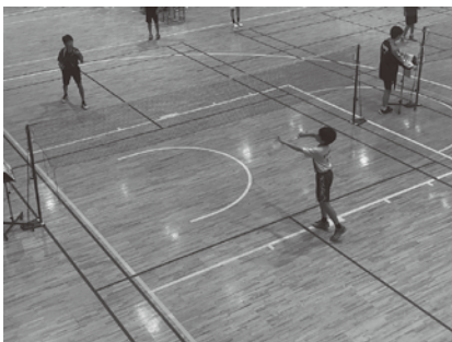
大会の様子 (バドミントン部)