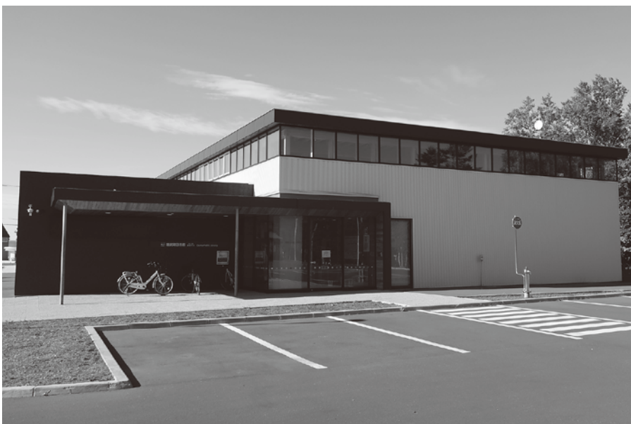
雄大なオホーツク海を望める雄武町図書館

教育長 観光客が最初に図書館を訪れるのか疑問であるが、観光客が本を読むことで松島について深く知る機会が得られるのであれば、本町図書室において松島関連の本を更に増やすよう努める。