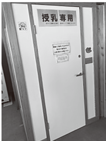
松島観光協会レストハウス内の 新型授乳室（宮城県産木材）

教育次長 指定管理者と検討し、トイレにおむつポットの設置を男女それぞれ1基設置した。