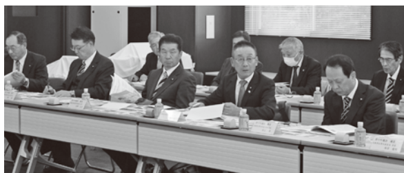
教育旅行について多くの質問がありました

令和5年11月16日(木)、 埼玉県滑川町議会議会が行政 視察のため来町されました。