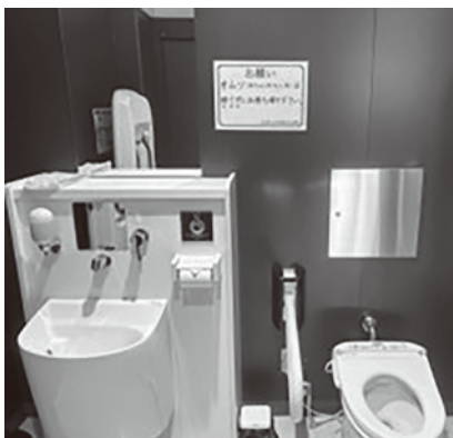
アトレる内の多目的トイレ内部