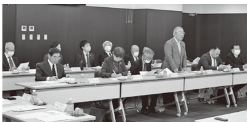
議員間で意見交換を行いました

令和5年11月16日(木)、 埼玉県滑川町議会議会が行政 視察のため来町されました。