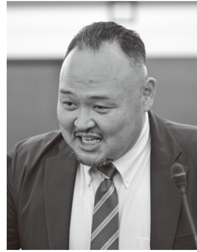
議員 二 隆 野 菅