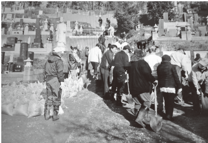
初原地区墓地管理組合の活動の様子

町長 次期長期総合計画を策定する中で、行政区との意見交換の場を設ける。また、アンケート調査を実施するなど住民の意見を反映できるよう努めていく。