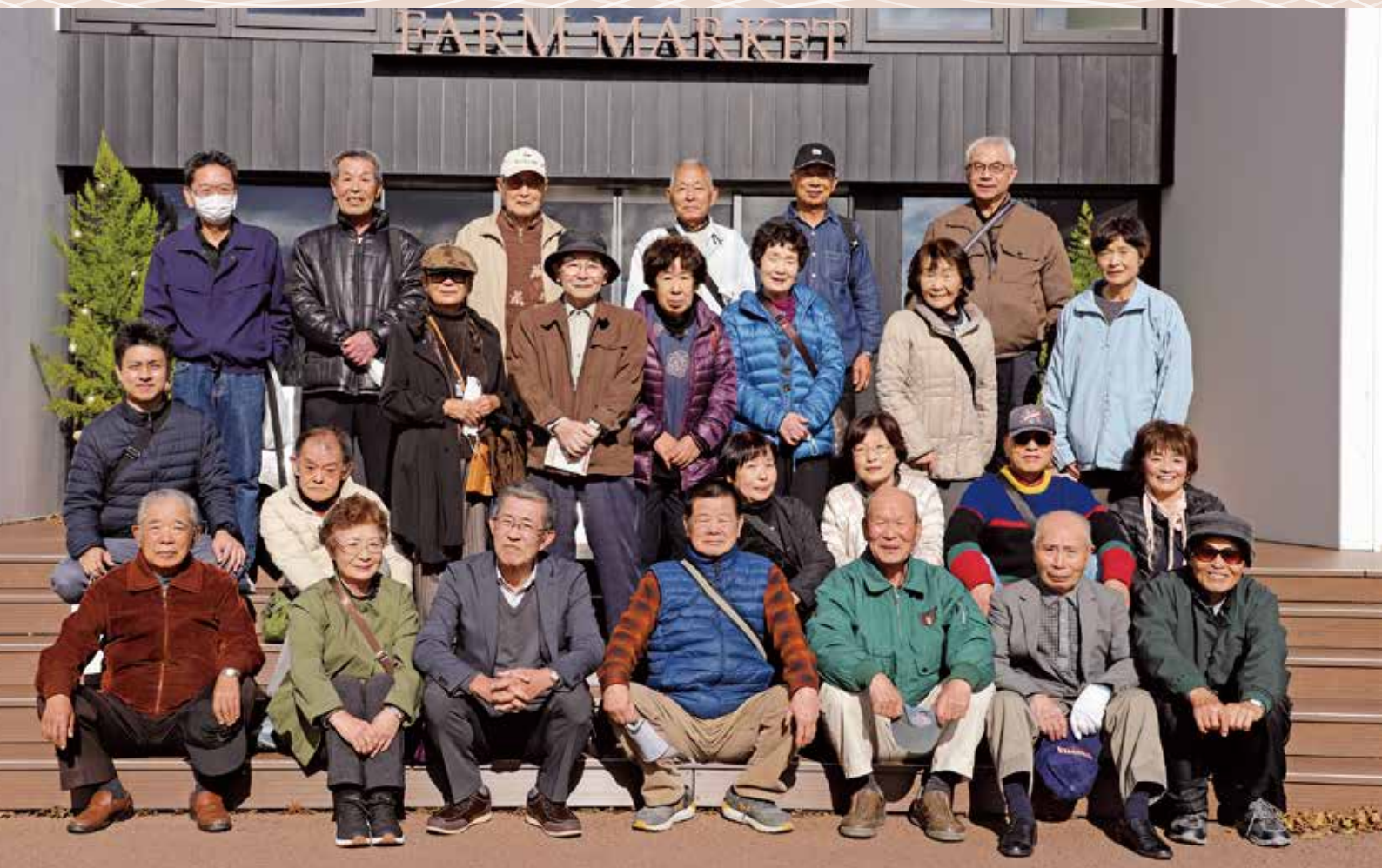
地区の活動シリーズ①本郷分館 Ark館ヶ森(岩手県藤沢町)へバス旅行