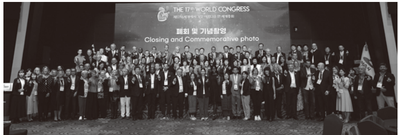
韓国麗水で行われた世界で最も美しい湾クラブ総会

問 町長は、先日韓国麗水で行われた世界で最も美しい湾クラブの総会に出席し、どのようなことを感じてきたか。