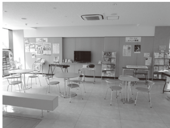
文化観光交流館のロビー

に應じ、積極的な出前講座に取り組んでいる。ぜひ御活用いただきたい。 教育次長 昨年からは順次行事や講座を再開している。大人と子ども達が交流する観点から、各種団体に協力をお願いし、幼稚園児の茶道体験、小学生のゲートボール教室や大漁唄い込みの伝承を行っており、今後も考えていきたい。