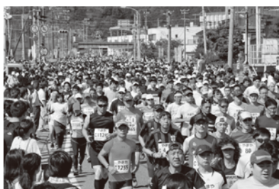
大会終了した「松島ハーフマラソン大会」

問 住民の健康増進と地域間・世代間交流を促進することを目指すべき環境づくりとして、「町道根廻・磯崎線」をメインコースに、小学生や高齢者も参加しやすく、また、障がい者への理解促進にも繋がるよう、車いす部門も同時開催する「松島マラソン大会」を新たに検討してはどうか。