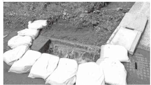
石田沢防災センター 排水工事前

建設課長 宮城県で舗装補修を実施する予定である。道路の除草は、県に実施を要望している。ごみは県が除草作業の際、回収をしている。