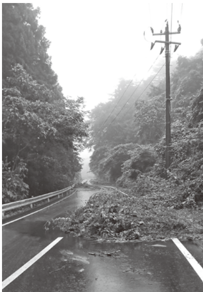
令和4年7月16日 町道高城桜渡戸線・白坂付近

問 最近の雨は、短時間で50ミリとか100ミリの雨が降る。昔の側溝では排水しきれず店に水が入る。側溝の見直しなど対策が必要ではないか。