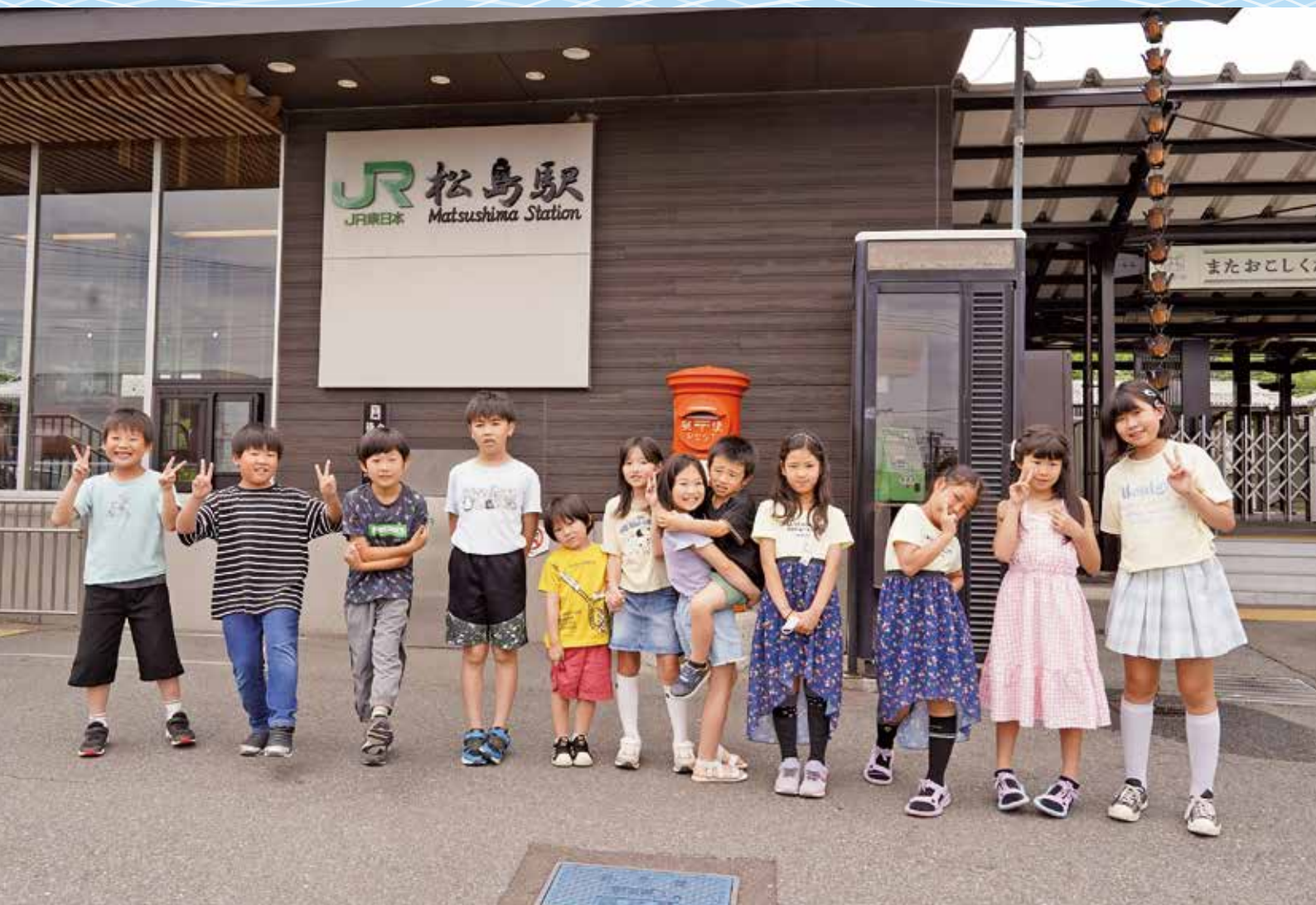
撮影場所 松島駅(松島7つの駅シリーズ⑥)