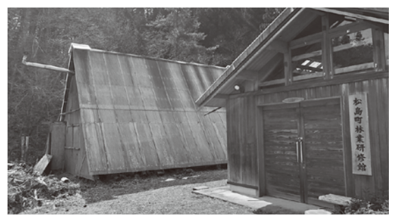
炭焼き研修施設(根廻地区)